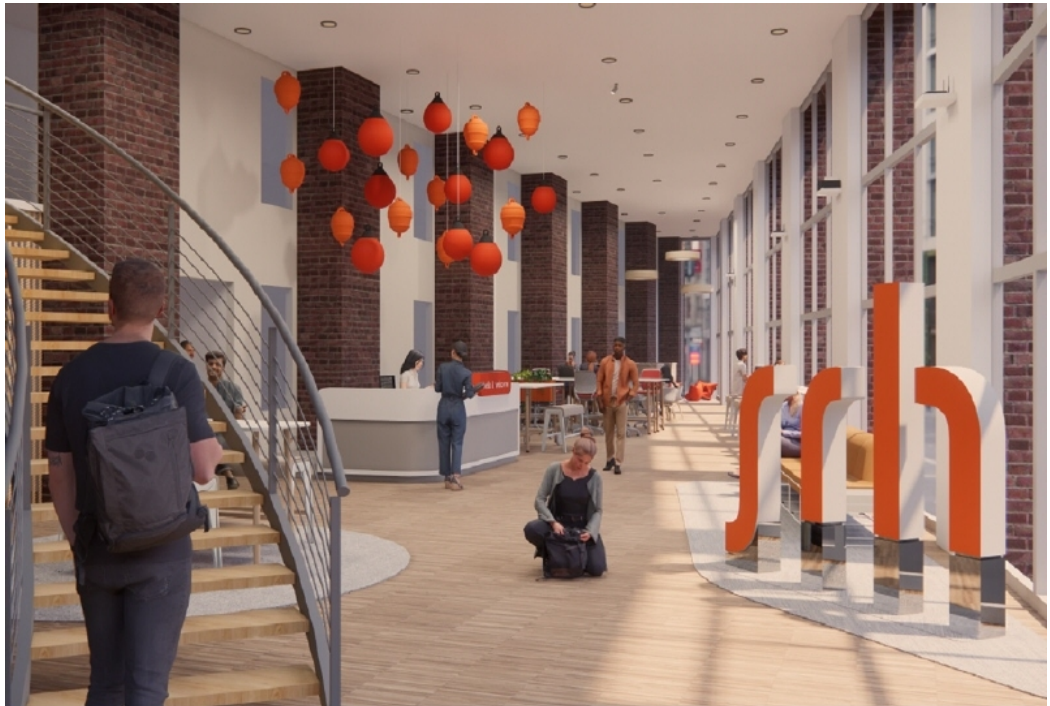
Innenansicht srh Campus