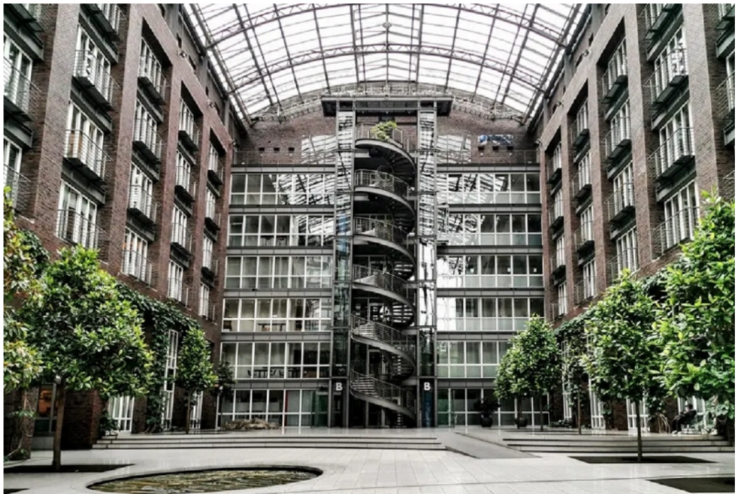
Atrium Ansicht 2