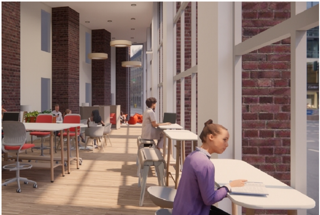
Innenansicht srh Campus 2