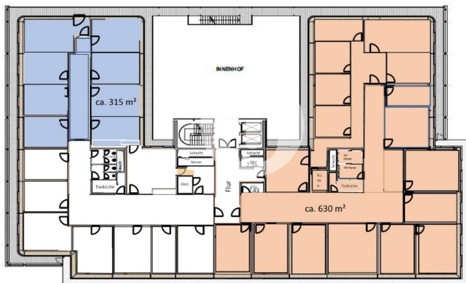
2 Obergeschoss mit ca 315 m 2 und mit ca 630 m 2