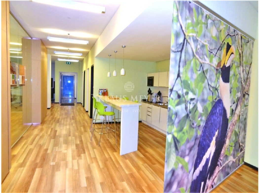
Beispiel Ausstattung Musterbüro (3)