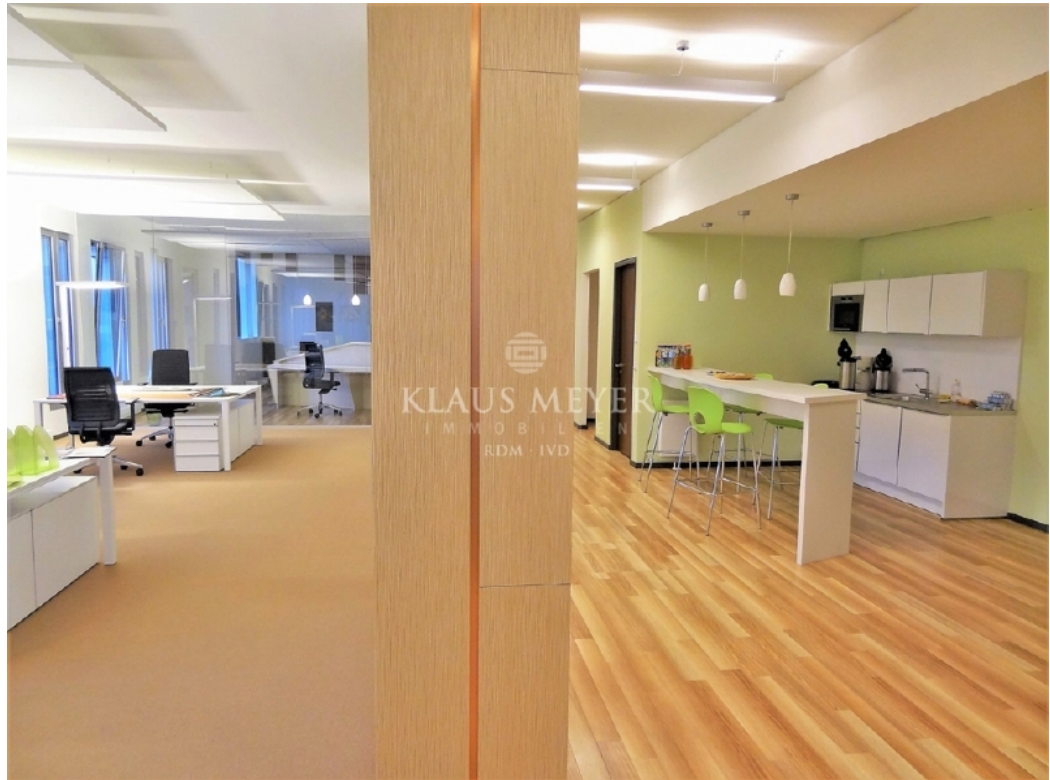
Beispiel Ausstattung Musterbüro (8)