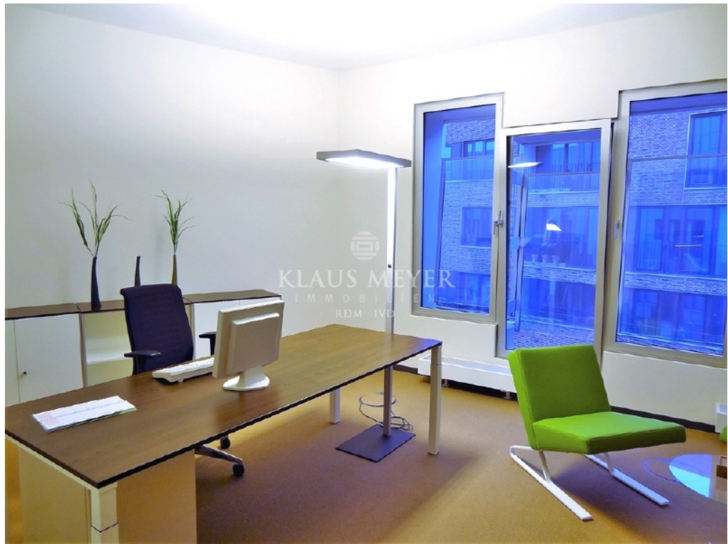
Beispiel Ausstattung Musterbüro (6)