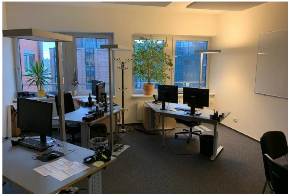
Innenansicht 1, 5 OG 618 m 2