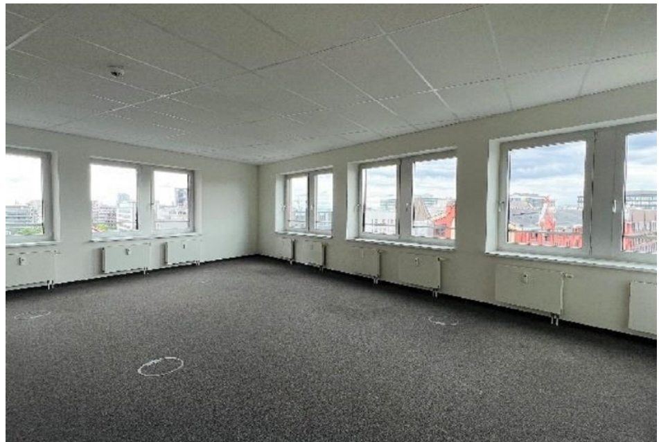
Innenansicht 2, 7 OG