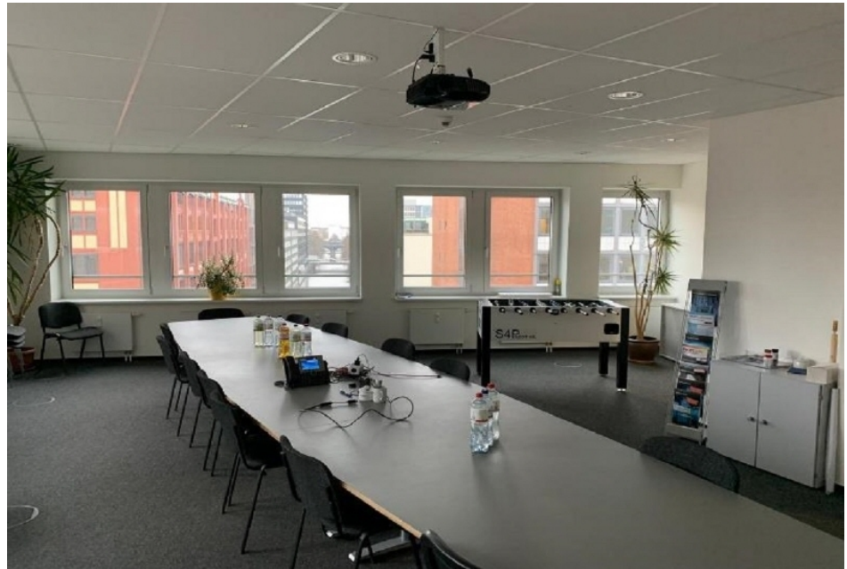
Innenansicht 2, 5 OG 618 m 2