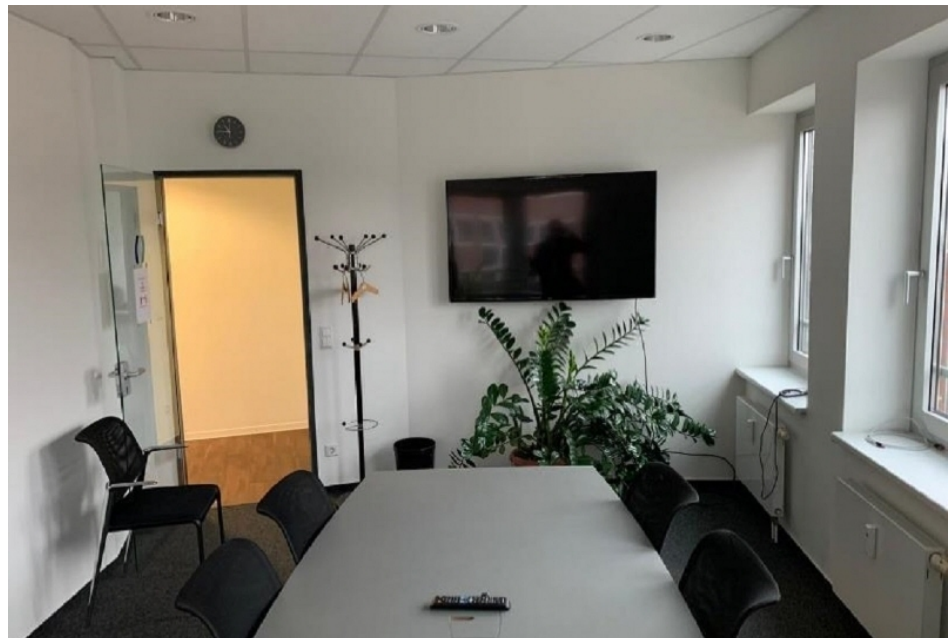
Innenansicht 3, 5 OG 618 m 2