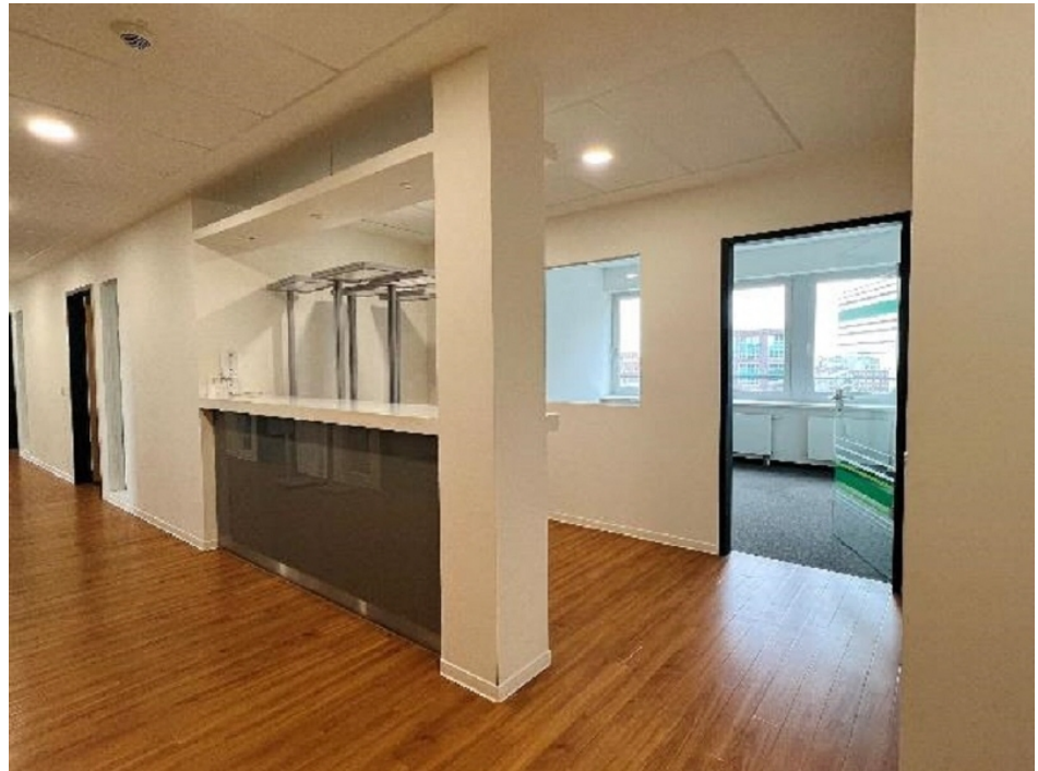
Innenansicht 1, 7 OG