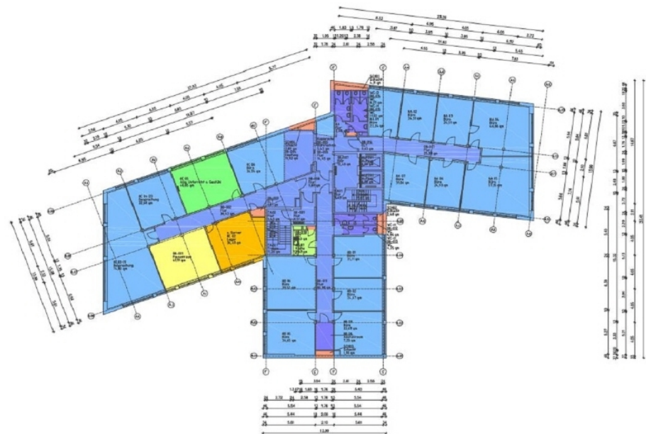
Grundriss 8 OG