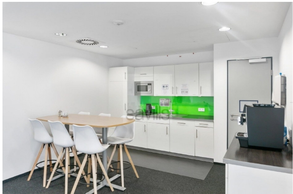
Pantry Hartzloh 25, Fuhlsbüttler Straße - Quartier21