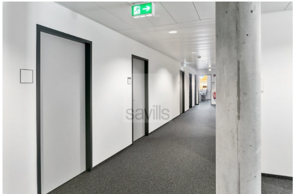
Flur Hartzloh 25, Fuhsbüttler Straße - Quartier21