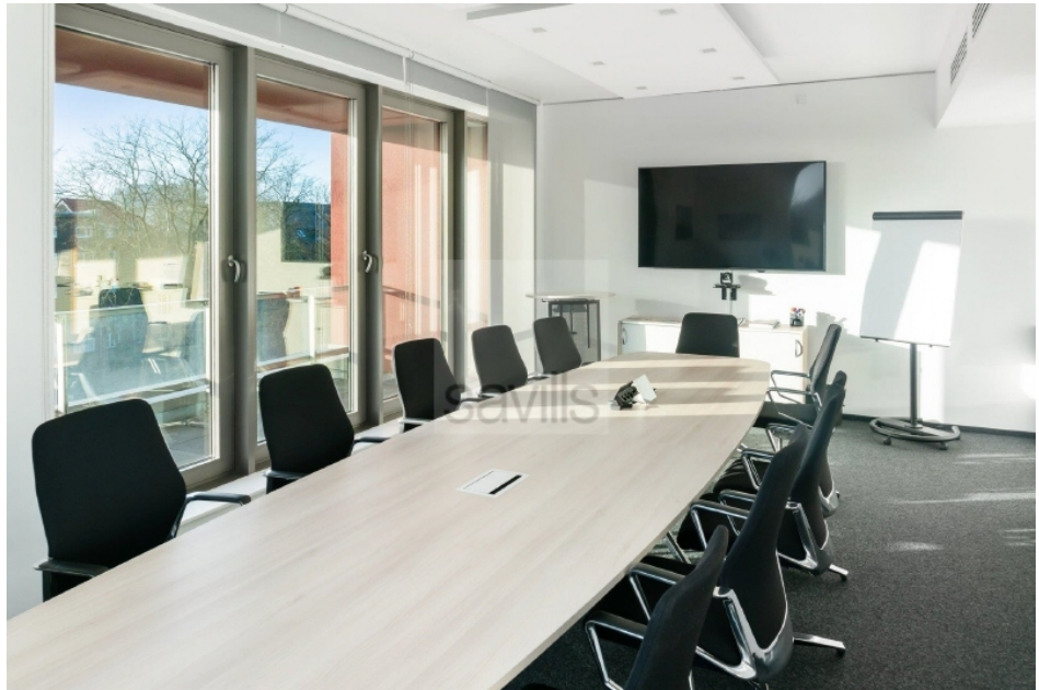
Konferenzraum 2 Hartzloh 25, Fuhlsbüttler Straße - Quartier21