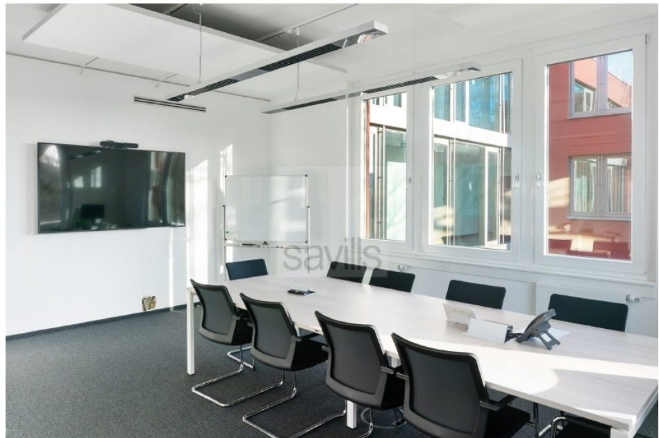
Konferenzraum 3 Hartzloh 25, Fuhlsbüttler Straße - Quartier21