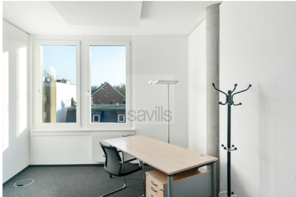
Büro 1 Hartzloh 25, Fuhlsbüttler Straße - Quartier21