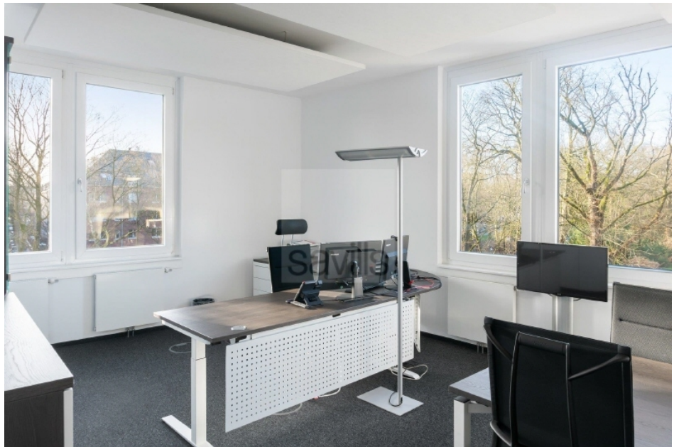
Büro 2 Hartzloh 25, Fuhlsbüttler Straße - Quartier21