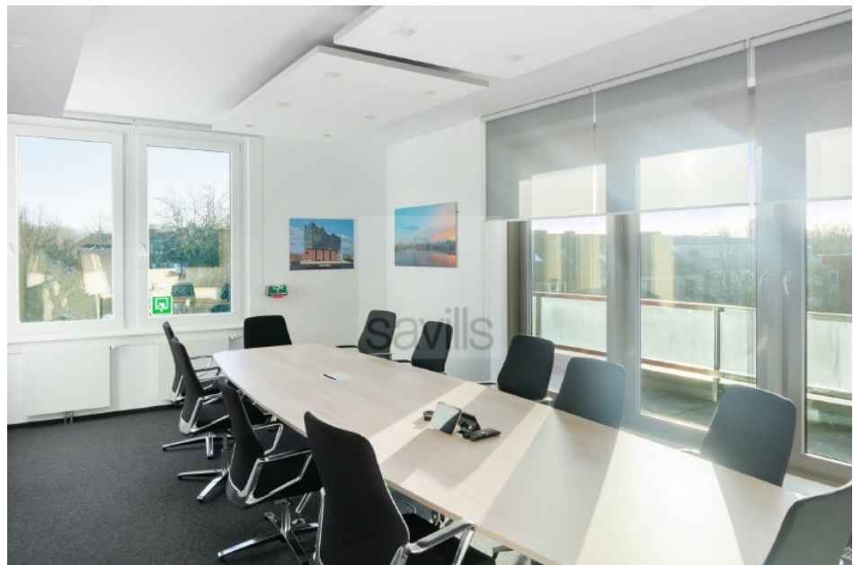
Konferenzraum 1 Hartzloh 25, Fuhsbüttler Straße - Quartier21