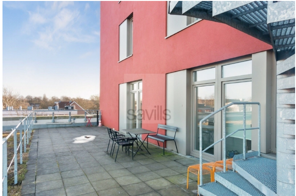
Dachterrasse Hartzloh 25, Fuhsbüttler Straße - Quartier21