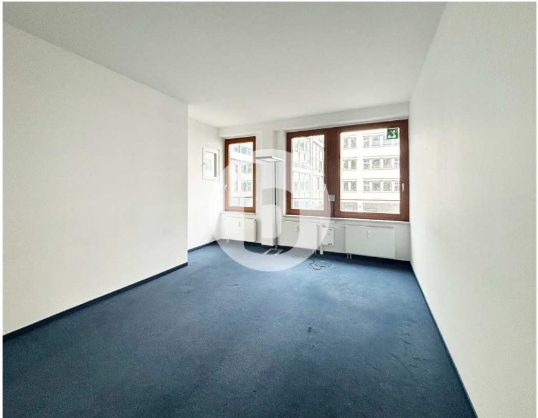
Süd-Etagen Hamburg City Bürogebäude Innenansicht