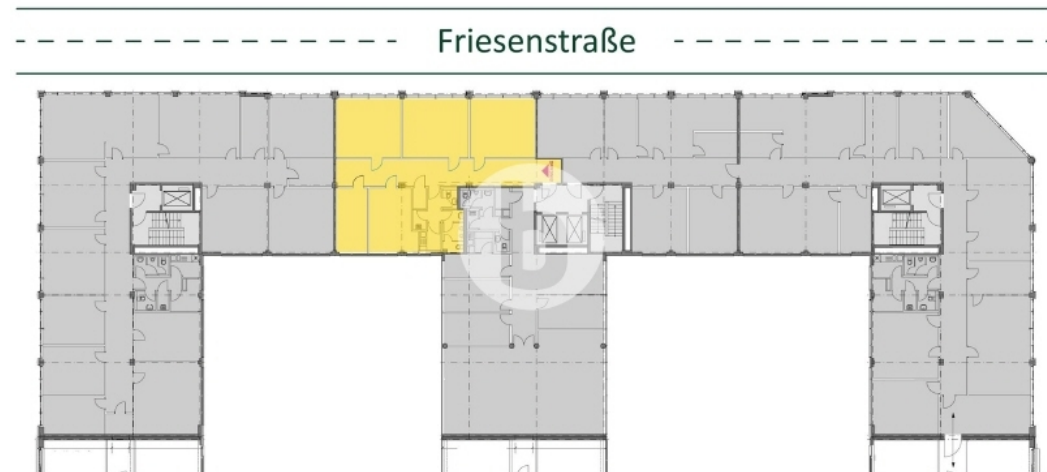
1. Obergeschoss mit ca 178 m 2