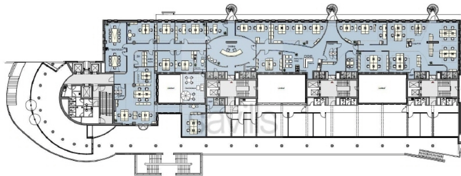
2 Obergeschoss, ca 1200 m 2