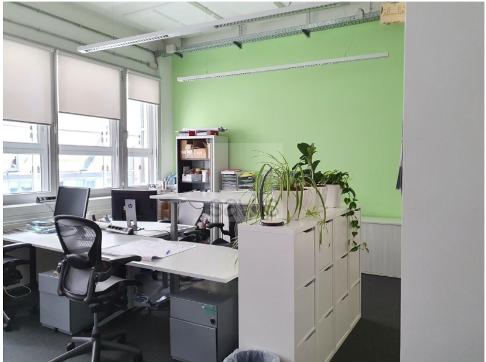
Büro, 2 Obergeschoss