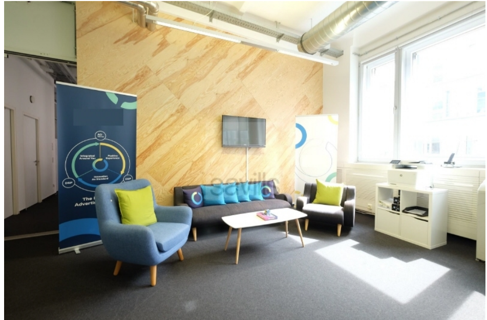
Lounge, 2 Obergeschoss