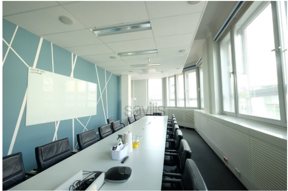
Konferenzraum, 2 Obergeschoss