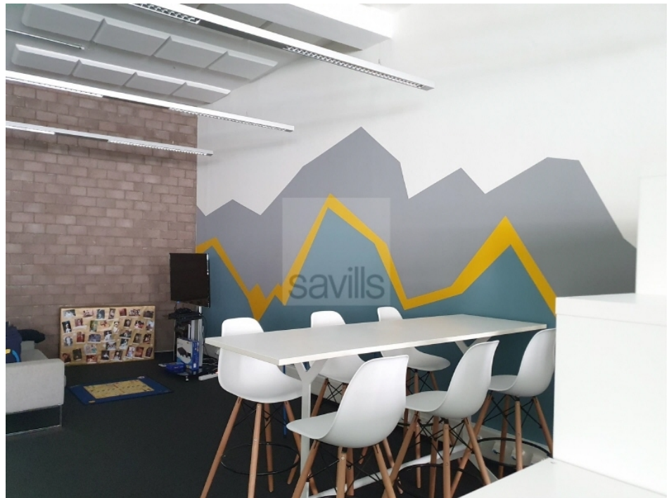
Lounge, 2 Obergeschoss