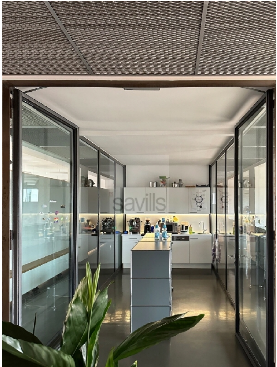
Große Elbstraße 14, Küche