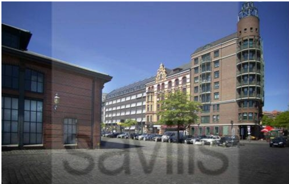
Blick vom Fischmarkt