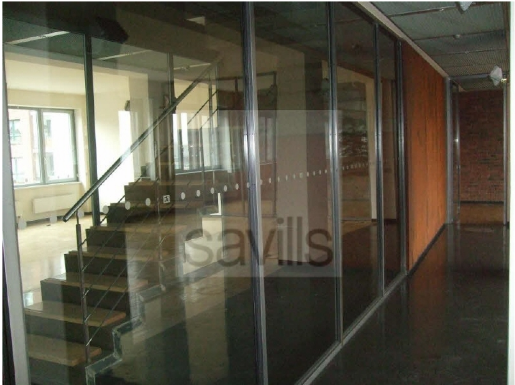
Treppenaufgang und Glaselemente