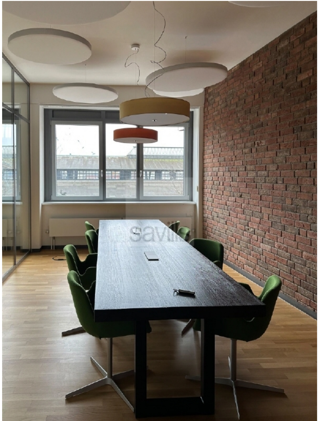
Große Elbstraße 14, Besprechungsraum