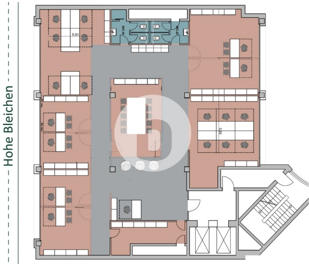
6 Obergeschoss mit ca 321 m 2