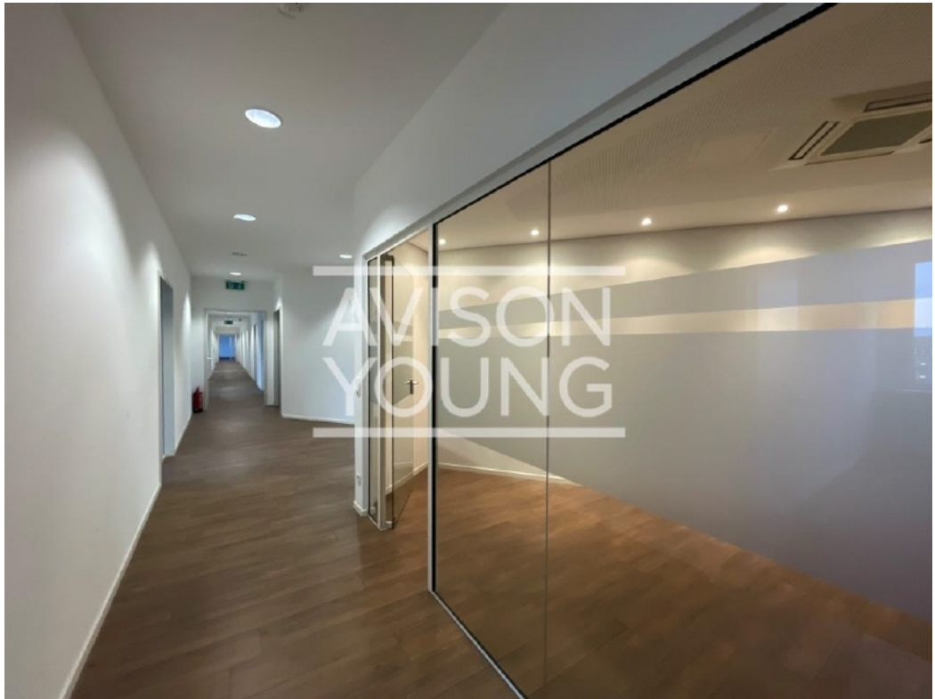
4 OG Flur