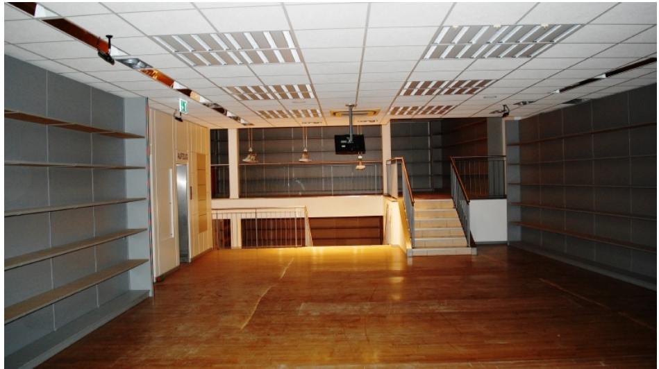
Verkaufsfläche 1 Obergeschoss