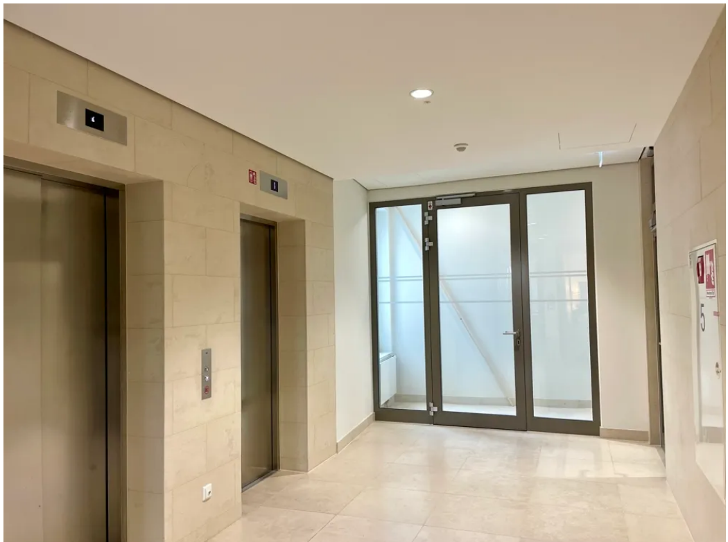
Eingang zur Bürofläche