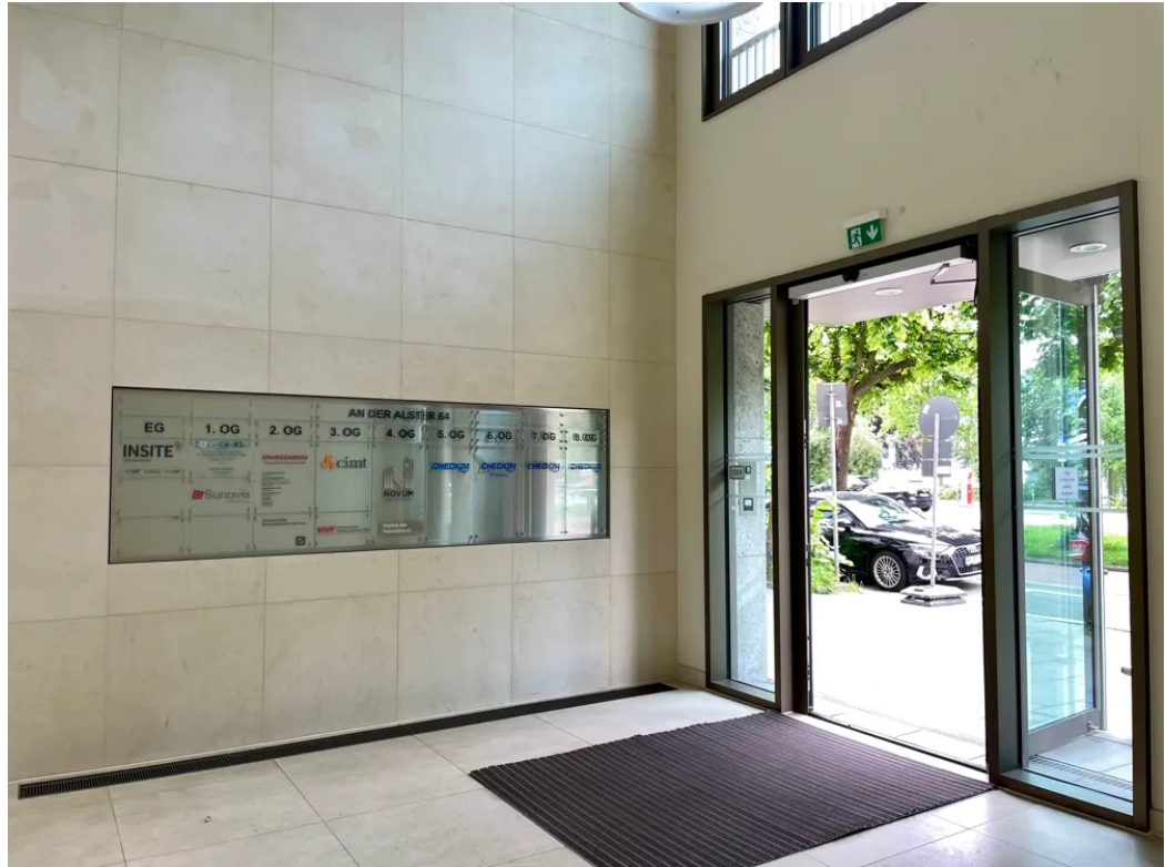
Eingang An der Alster