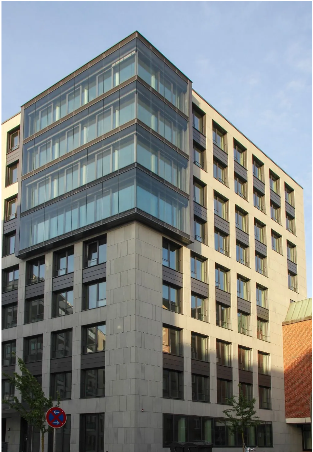
Ansicht II Haus B