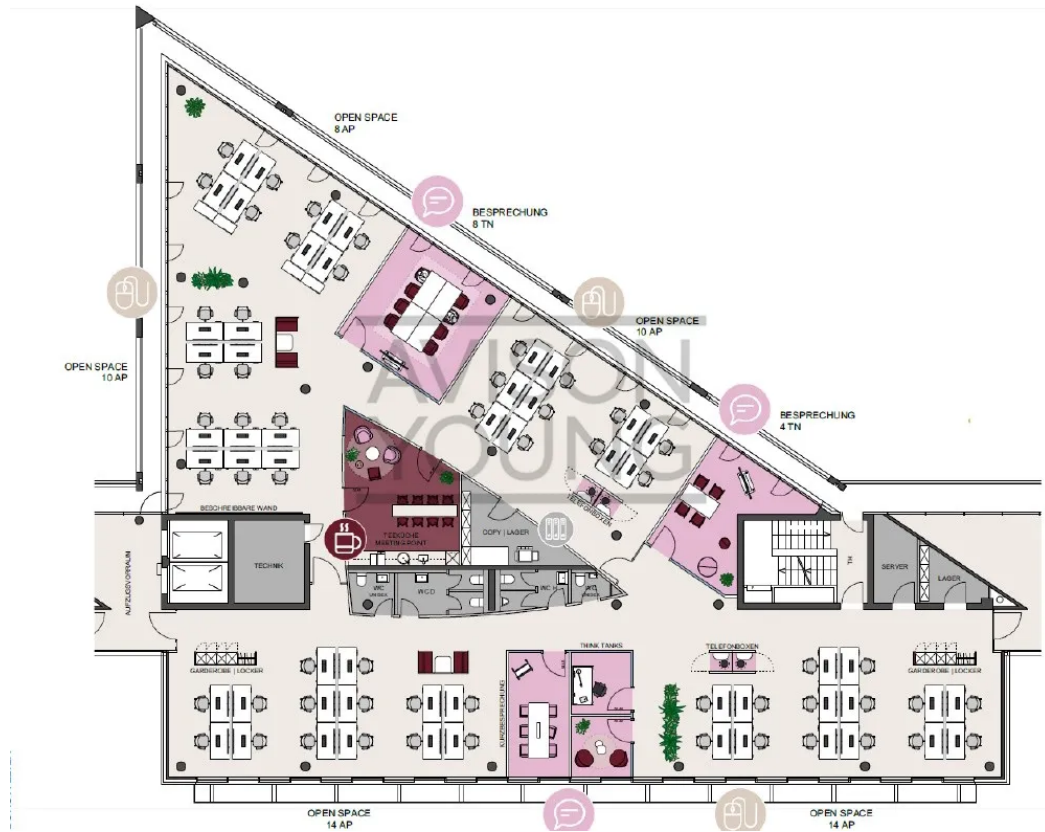
Regelgeschoss Open Space