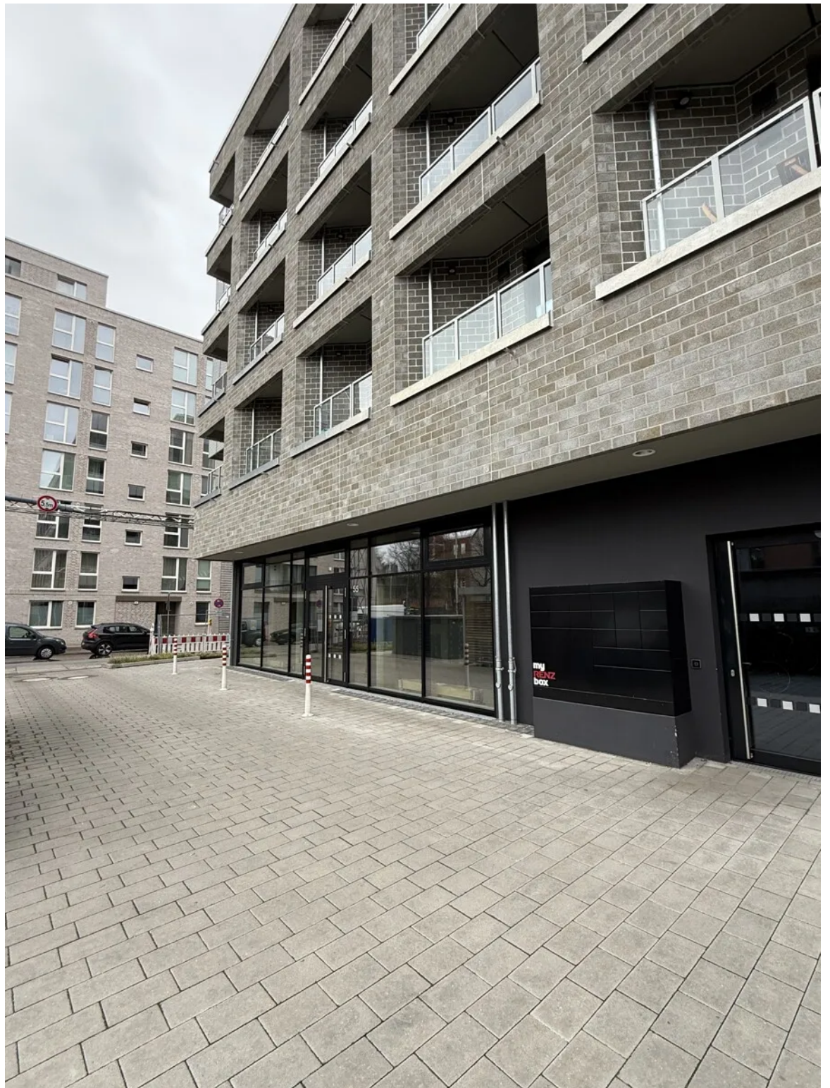
Neubauerstbezug: Eckladenfläche im Studentenwohnheim