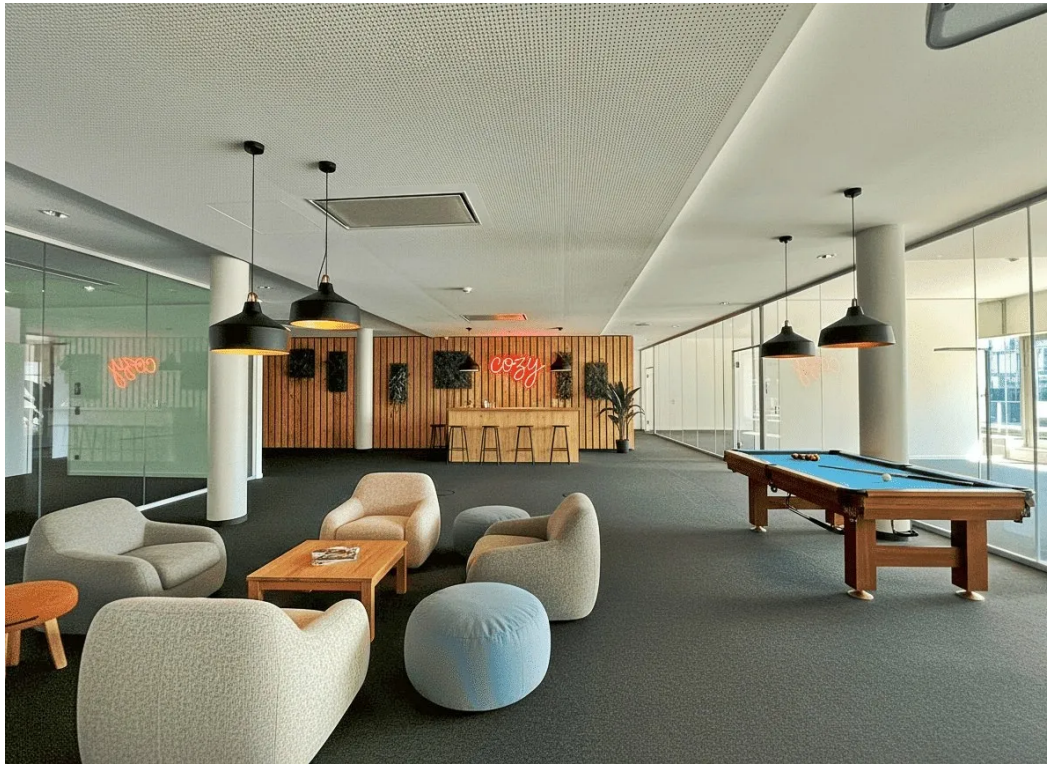
Innenansicht - Visualisierung