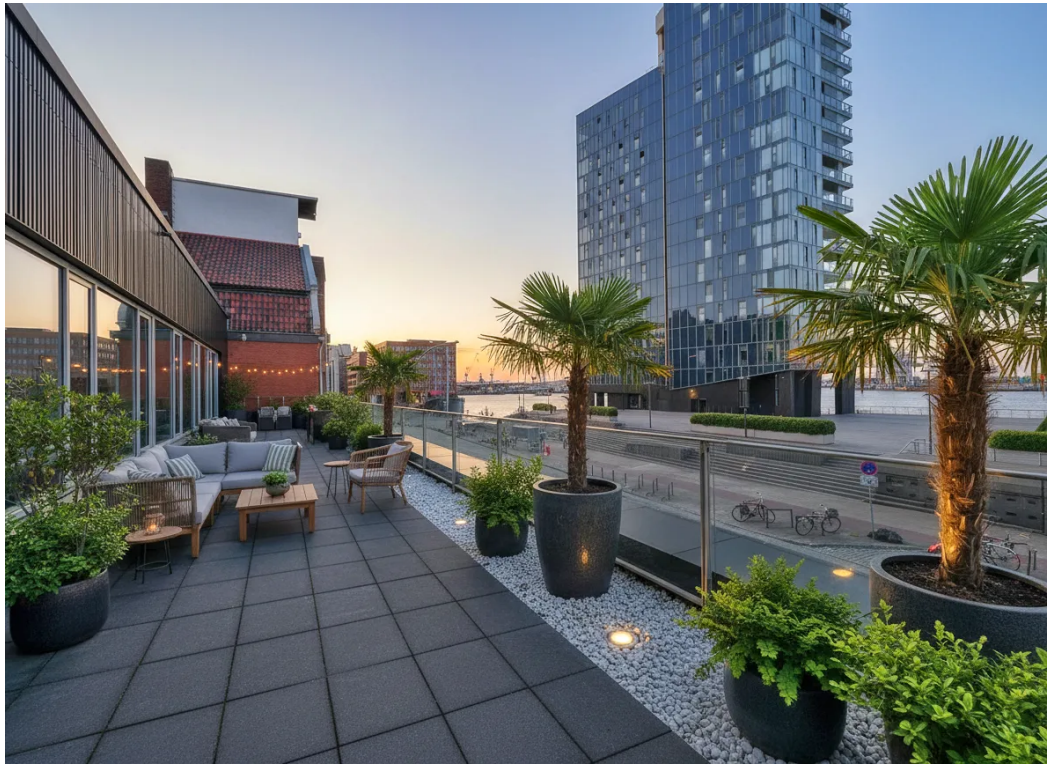
Terrasse - Visualisierung