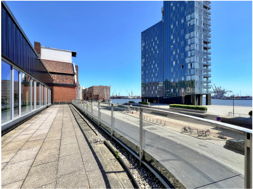
Terrasse - Bestand