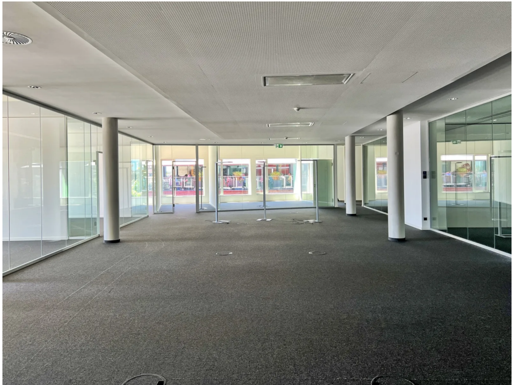
Innenansicht - Bestand