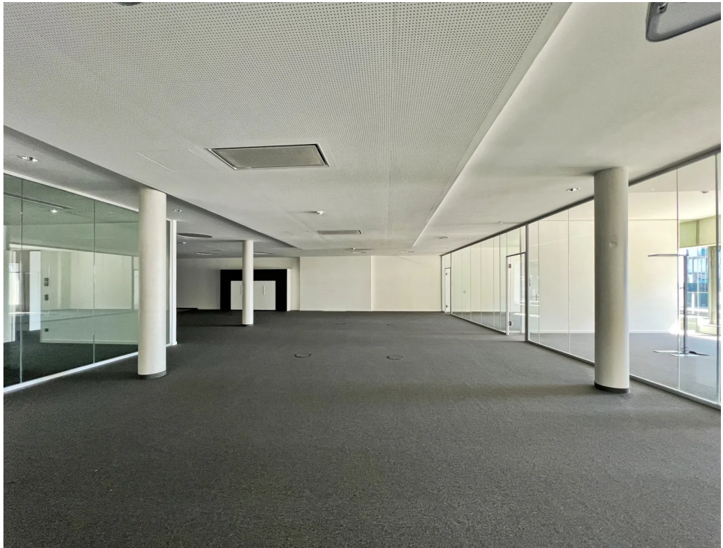
Innenansicht - Bestand