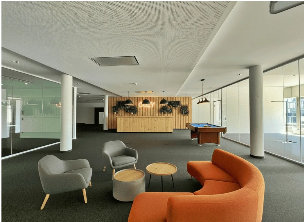
Innenansicht - Visualisierung