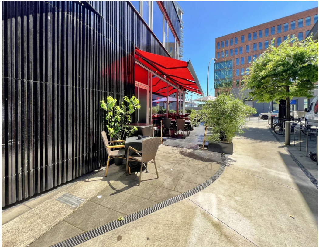
Eingangsbereich - Gastro