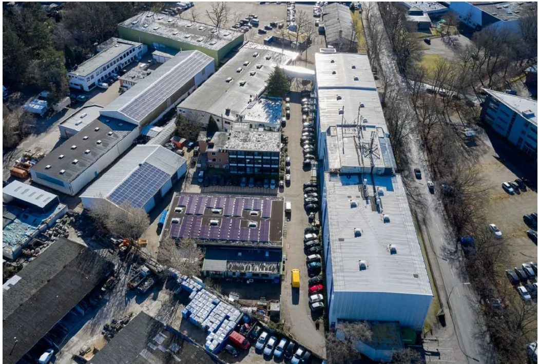
Sirius Business Park Norderstedt Luftbild