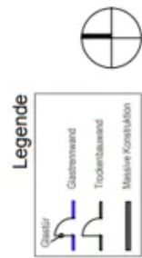
1.OG Fleet ca. 670m 2