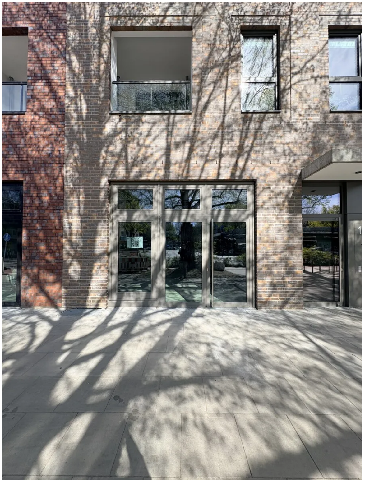
Moderne Ladenfläche im neuen Wohn- und Gewerbequartier am Eidelstedter Platz