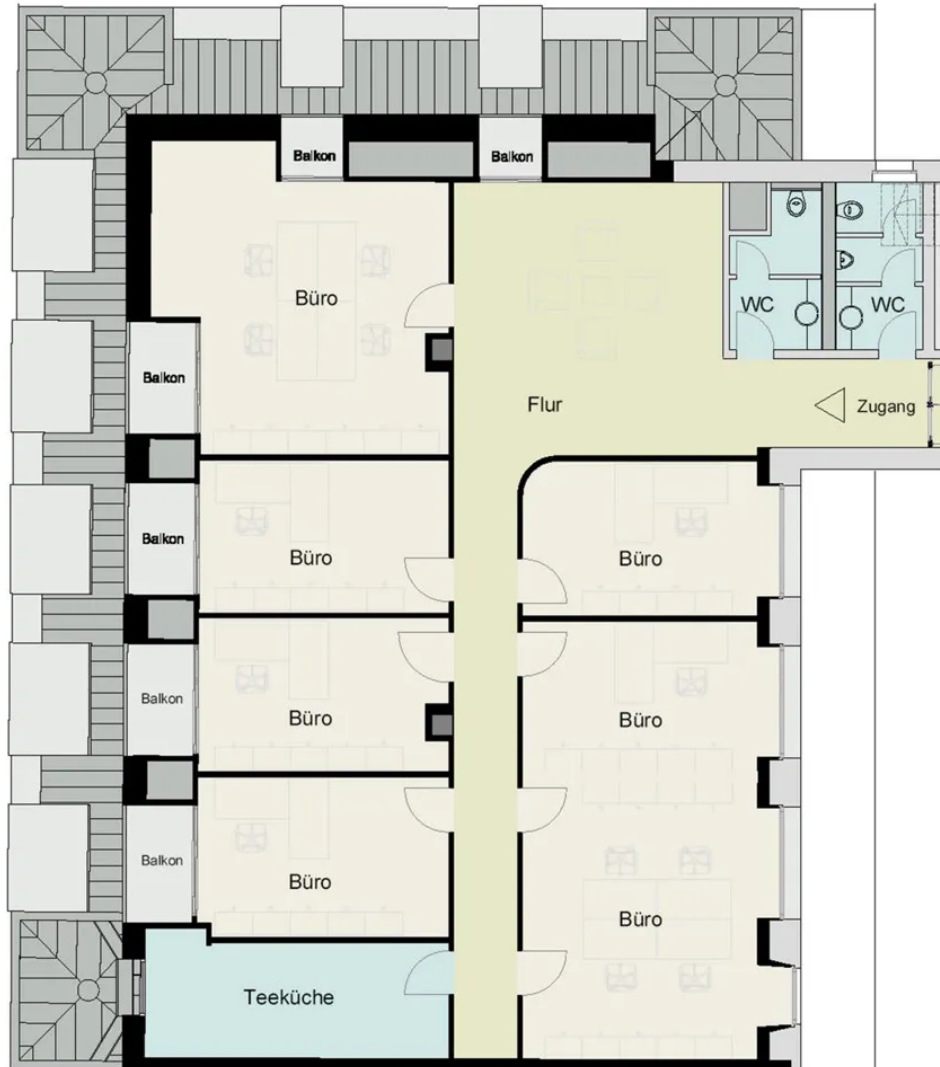
Grundriss 6. OG - ca. 240 m 2