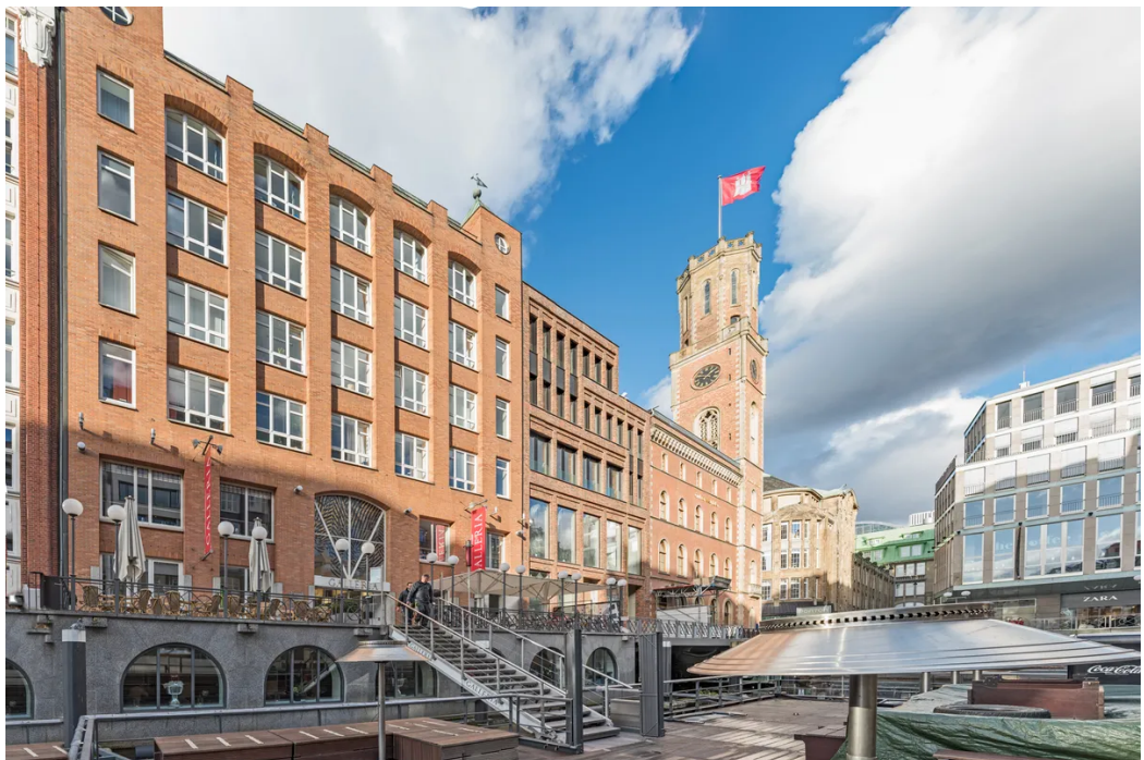
Weitere Ansichten - Rückansicht