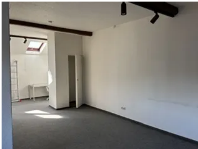
DG links Raum Bild 2