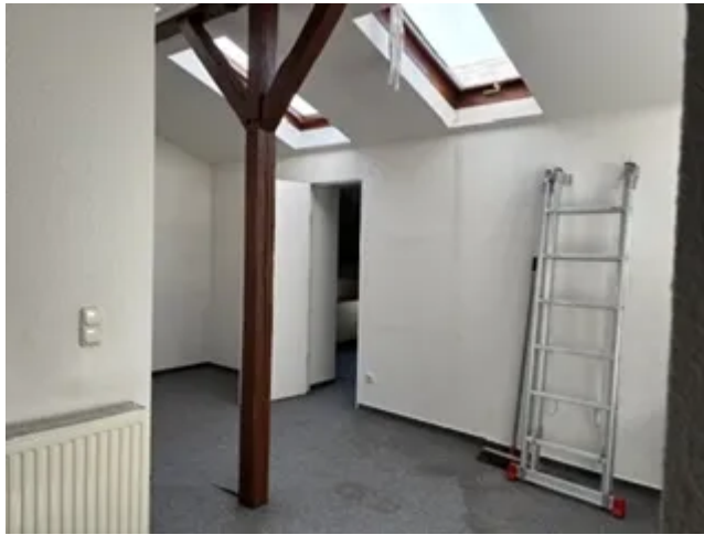
DG links Flur Bild 1