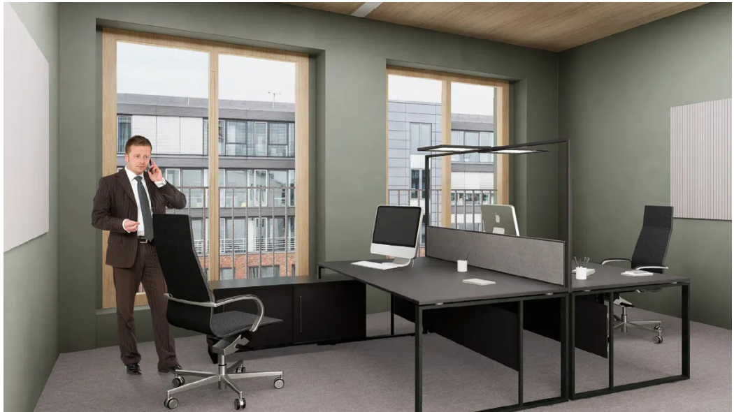
Weitere Ansichten - Muster Büro