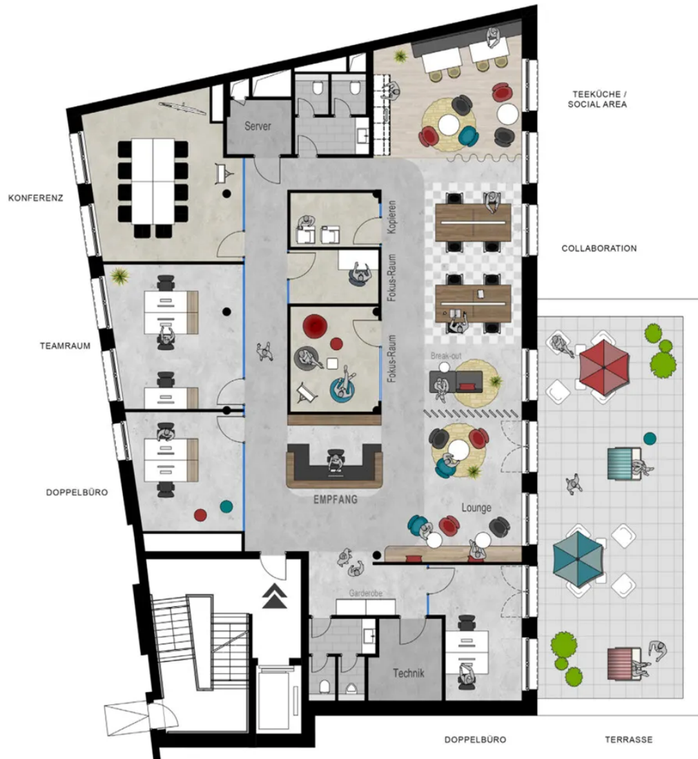
Grundriss 2. OG - ca. 360 m 2 - Musterplanung klassisch