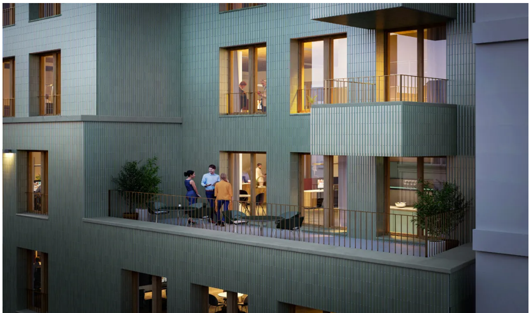
Weitere Ansichten - Balkon