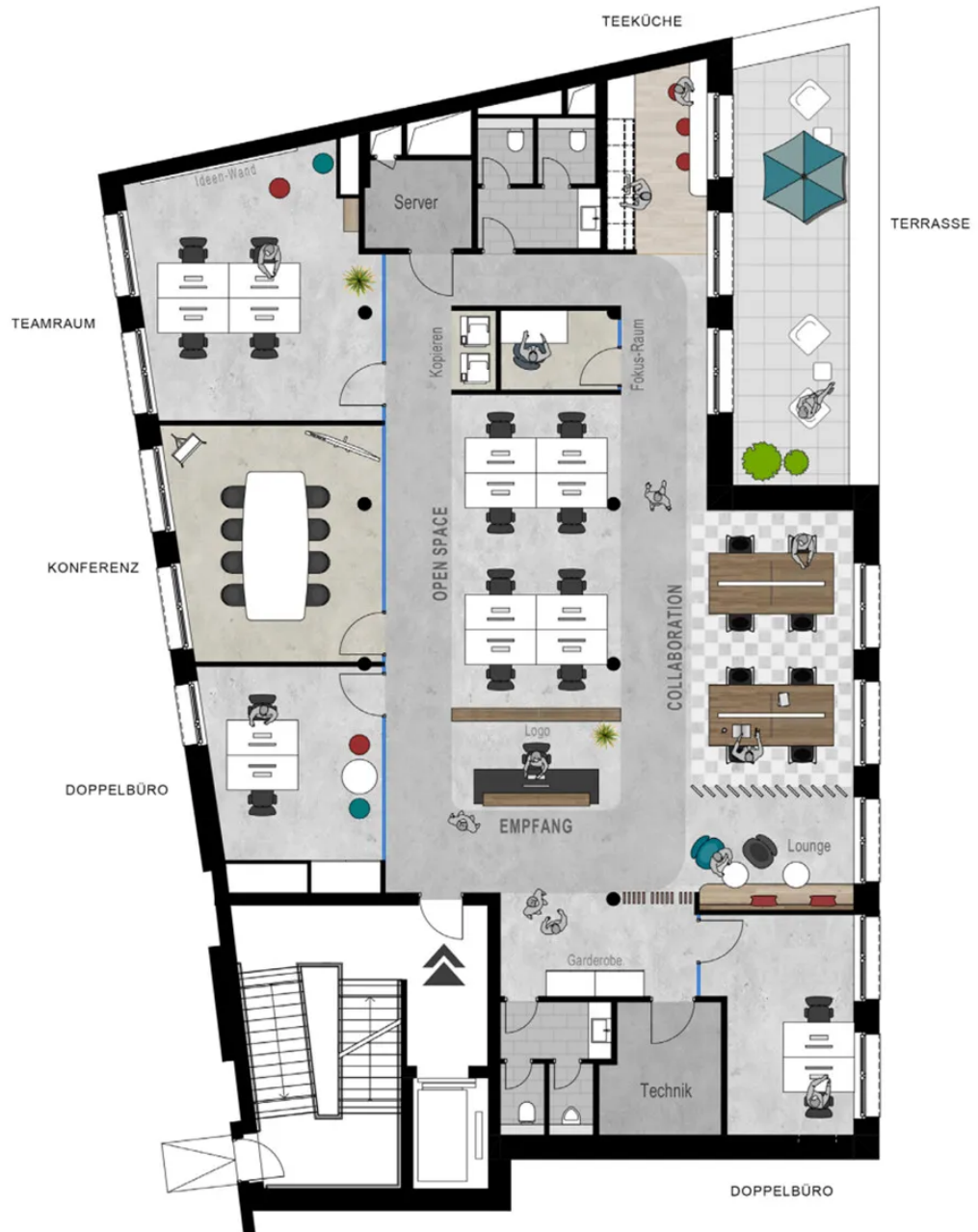
Grundriss 4. OG - ca. 310 m 2 - Musterplanung open space