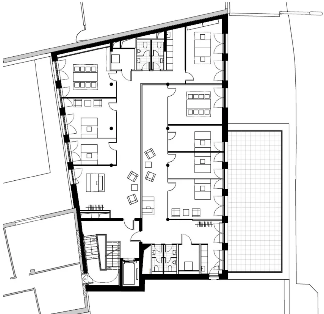
Grundriss 6. OG - ca. 300 m 2 (inkl. 50 % Terrasse) mit exemplarischer Mietflächentrennung