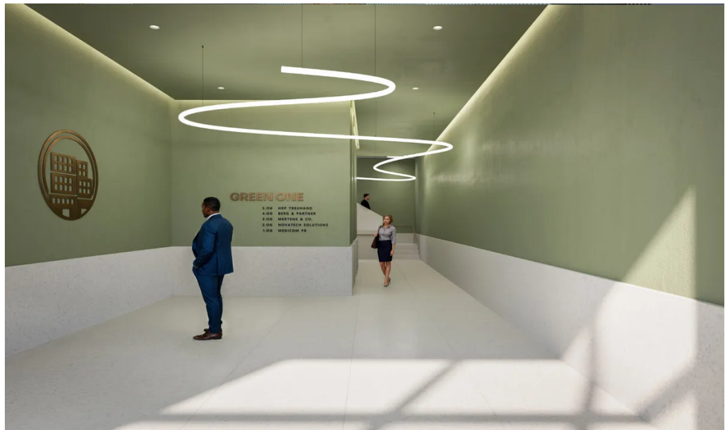
Weitere Ansichten - Eingangsbereich