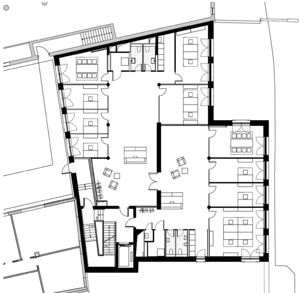
Grundriss 1. OG - ca. 420 m 2