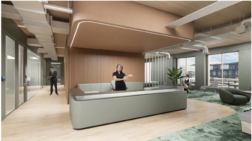
Weitere Ansichten - Muster Empfangsbereich Büro