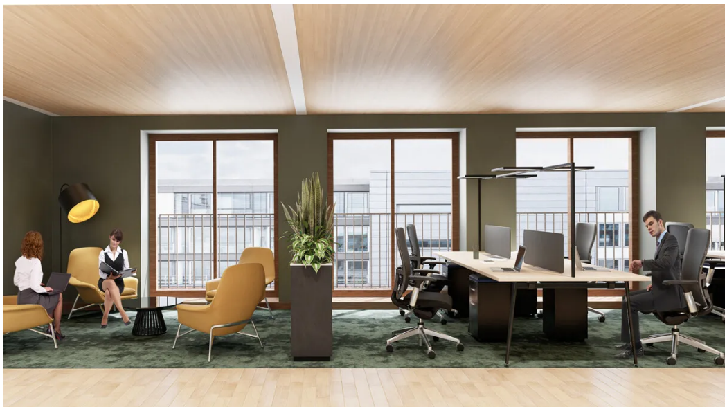
Weitere Ansichten - Muster Büro