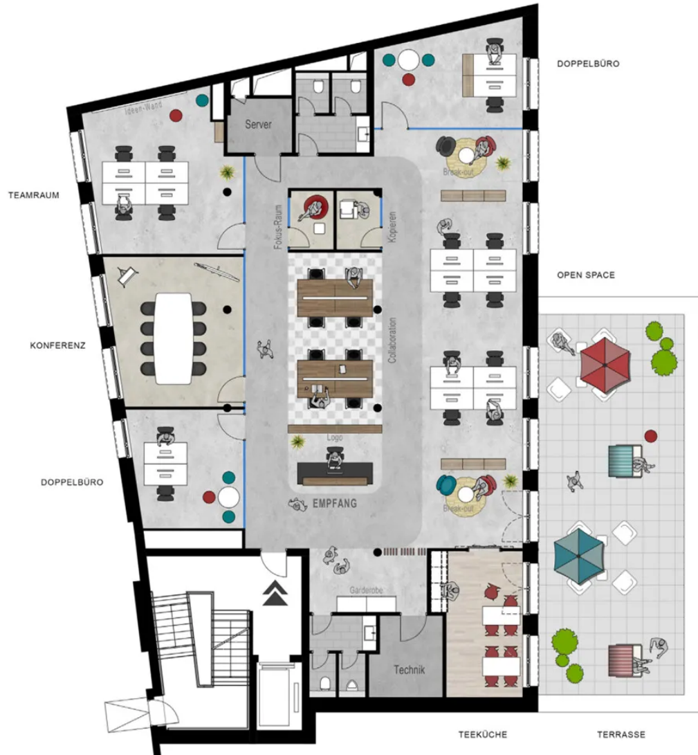
Grundriss 2. OG - ca. 360 m 2 - Musterplanung new work