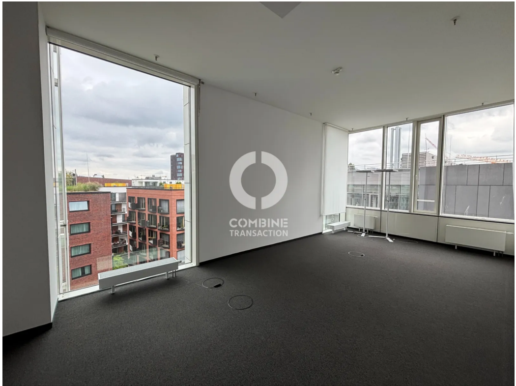
Innenansicht 7. OG