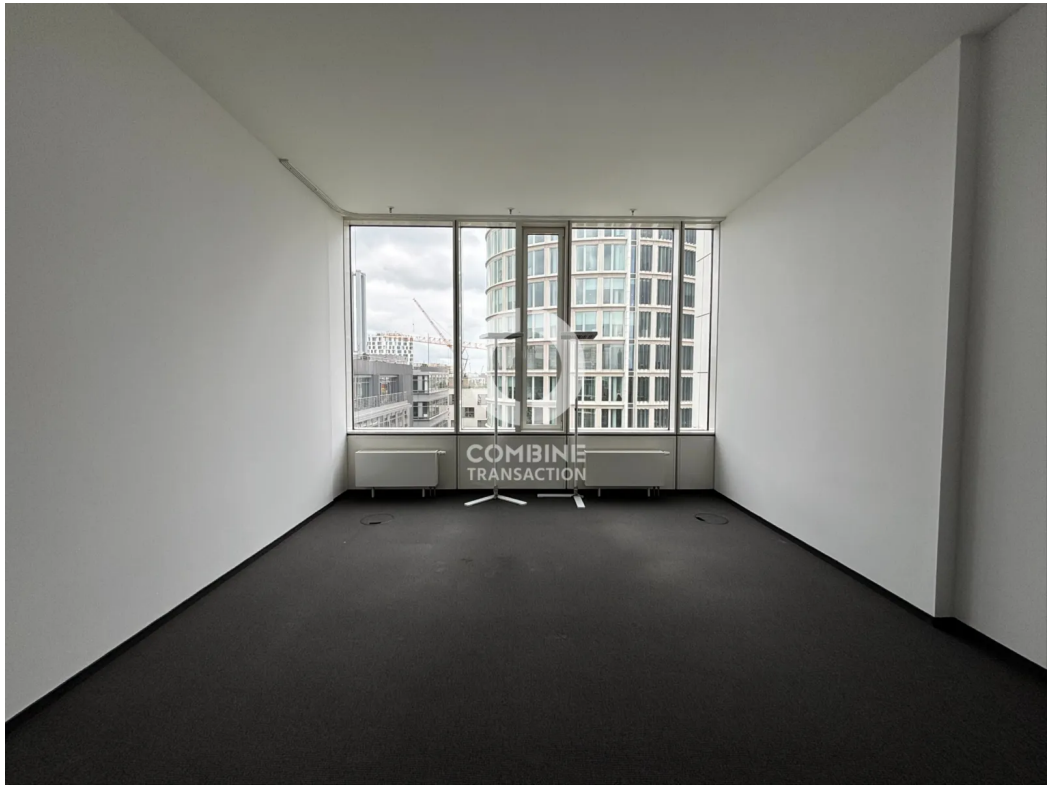
Innenansicht 7. OG