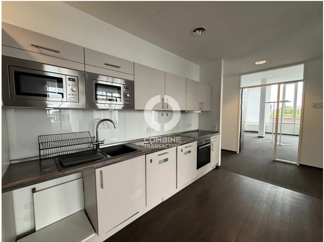
Innenansicht 7. OG