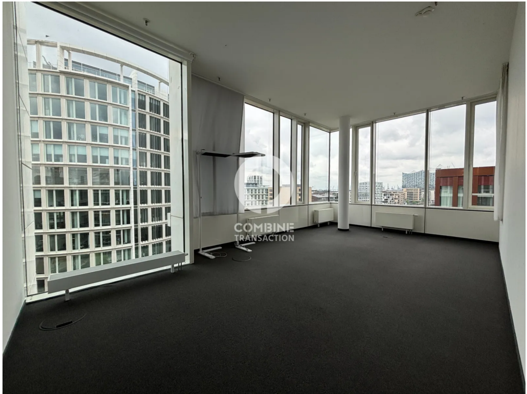
Innenansicht 7. OG