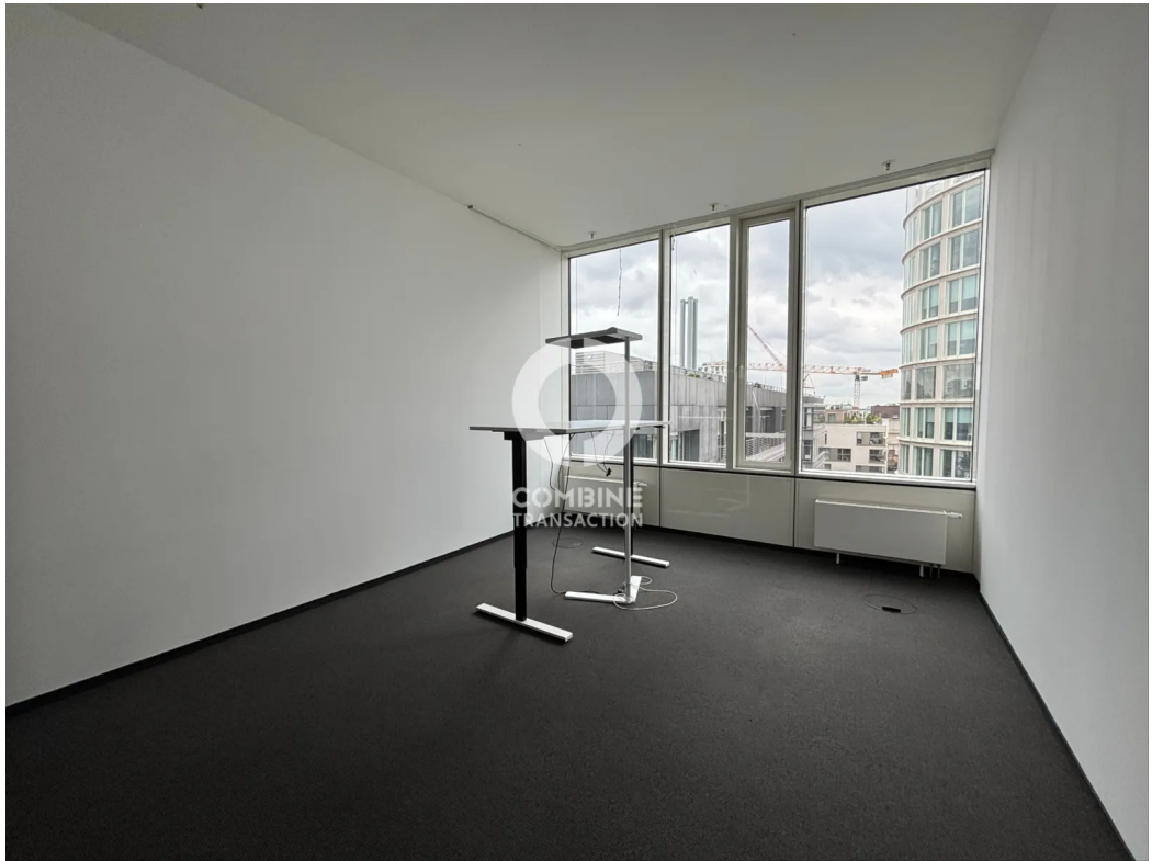
Innenansicht 7. OG