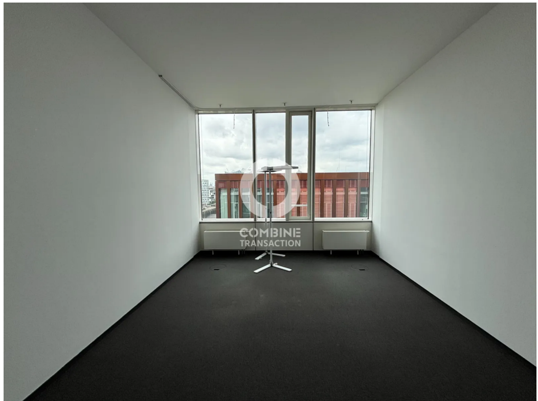
Innenansicht 7. OG