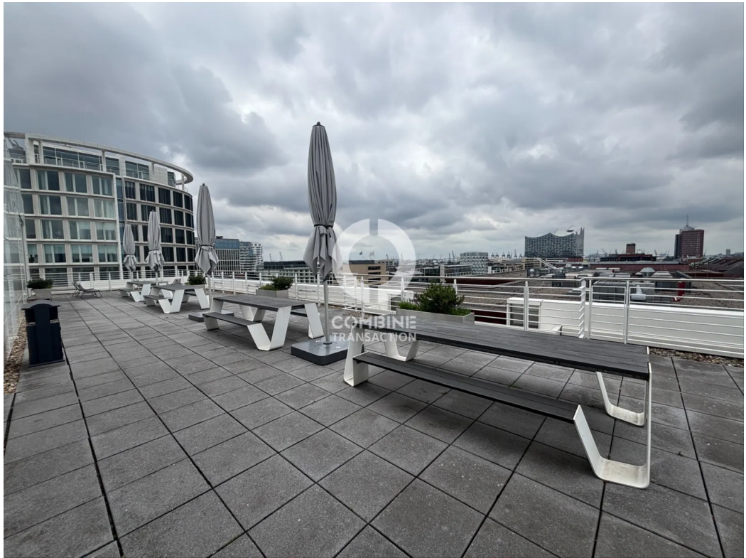
Dachterrasse 8. OG