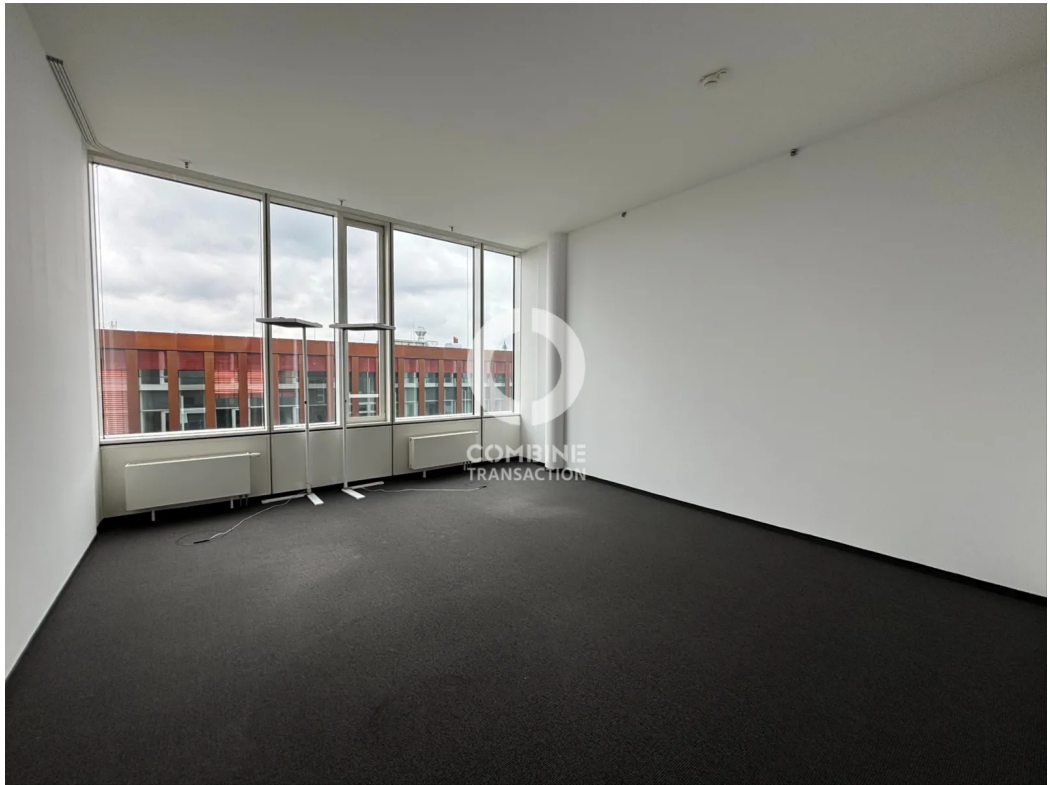
Innenansicht 7. OG