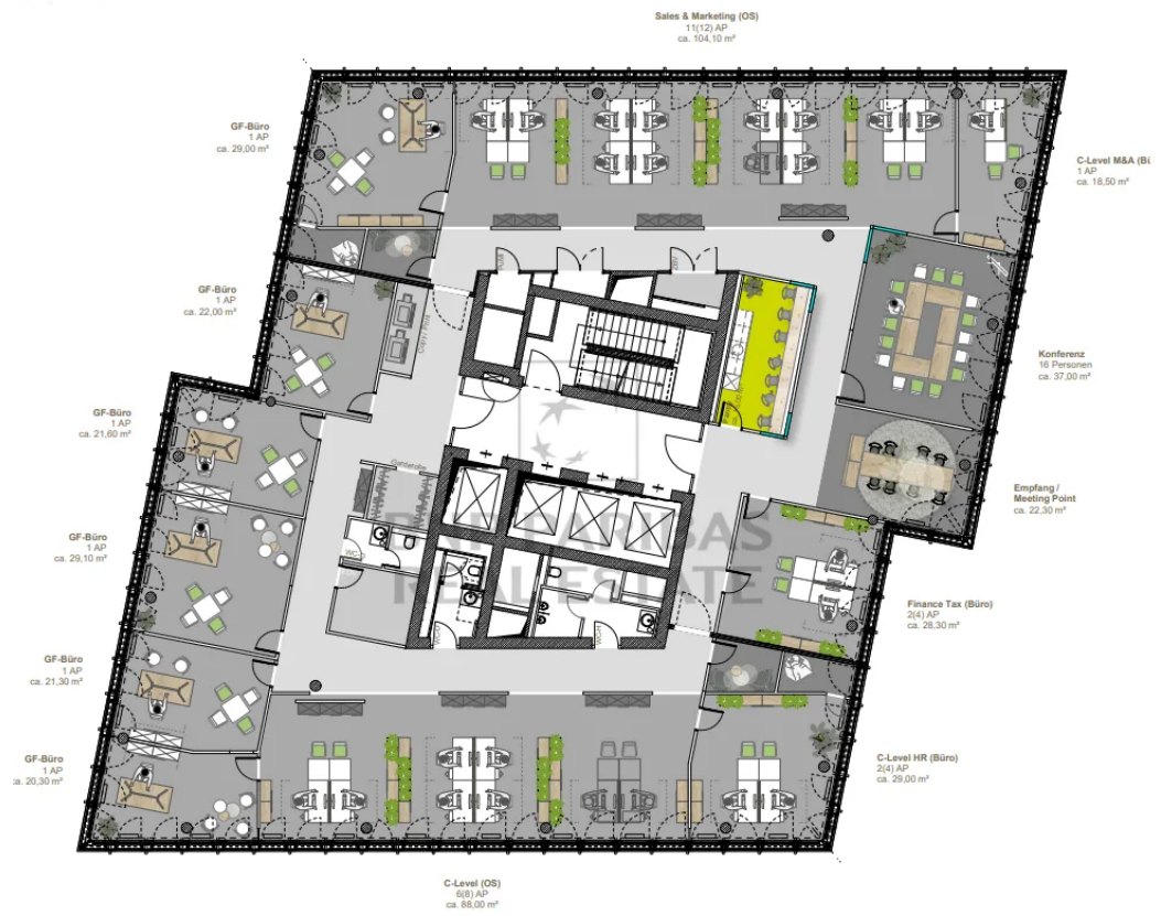
Musterplanung - 11. OG