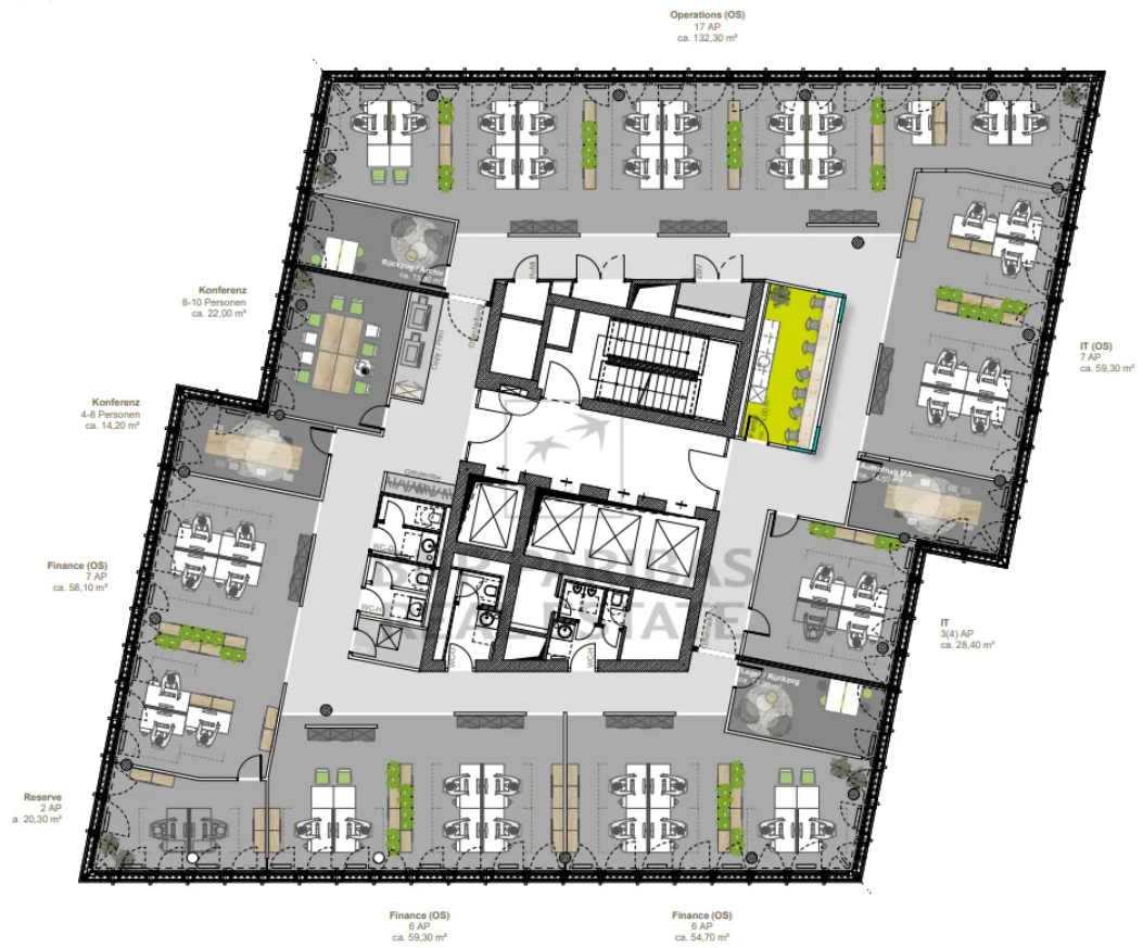
Musterplanung - 10. OG