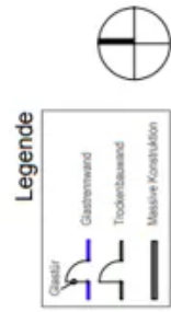
1.OG Fleet ca. 670m 2