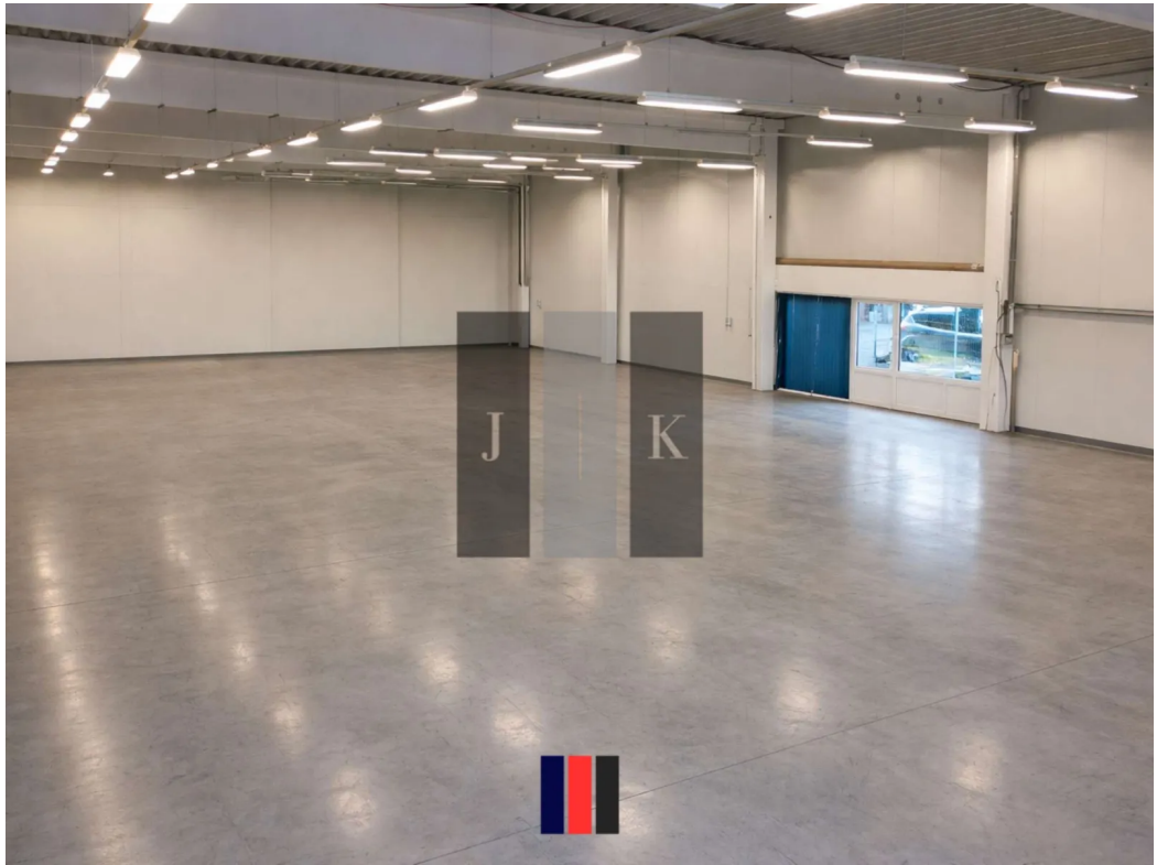
Halle Innenansicht 2 (Visual.)