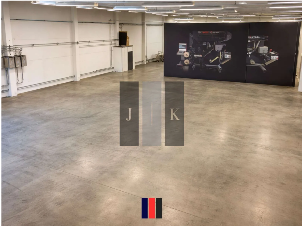
Halle Innenansicht 4 (Visual.)