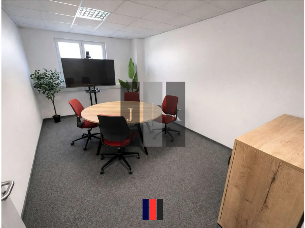
Büro Innenansicht 1 (Visual.)