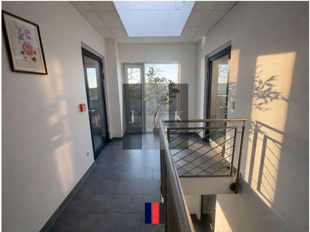
Büro Obergeschoss (Visual.)