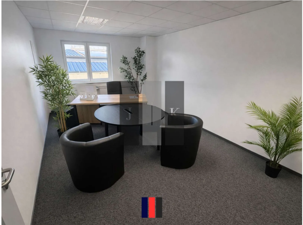
Büro Innenansicht 3 (Visual.)