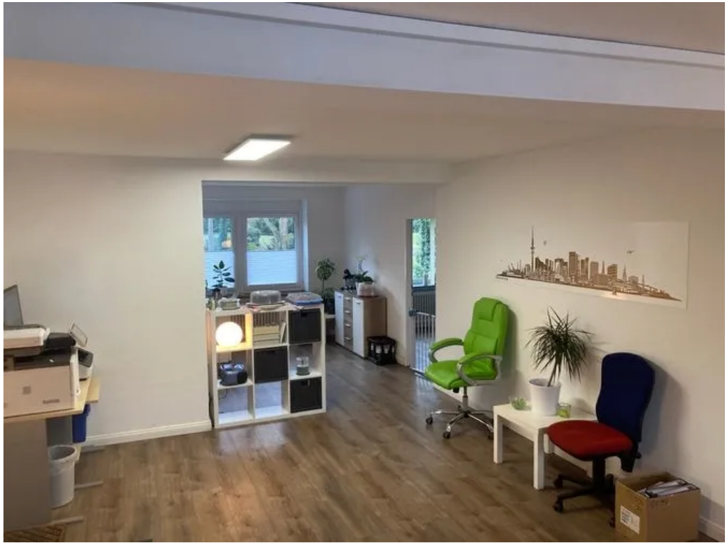
Beispiel im Büro