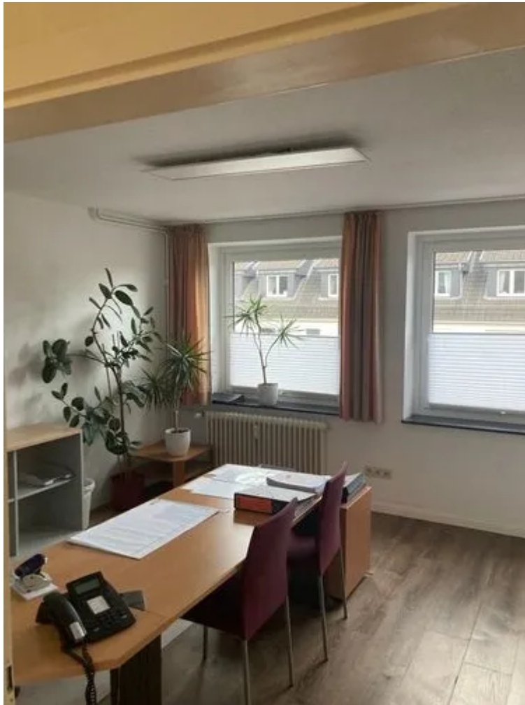
Beispiel im Büro