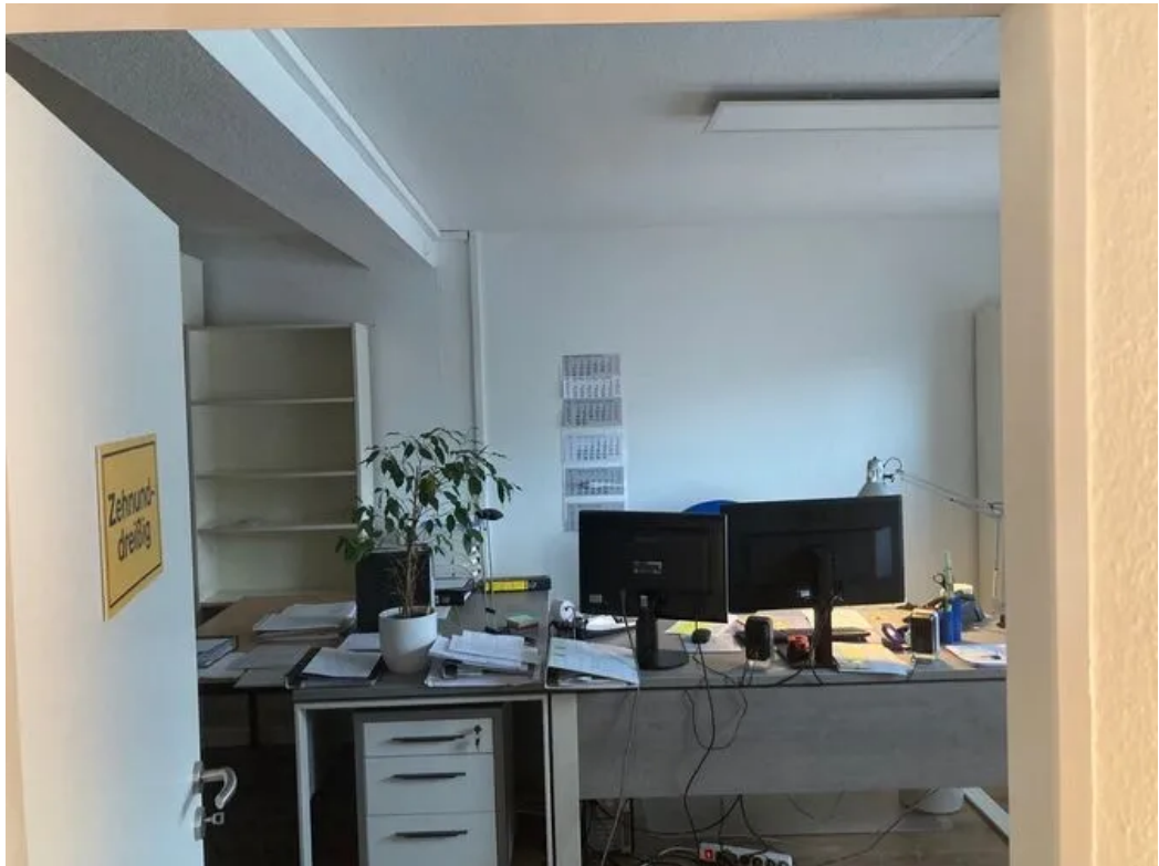
Beispiel im Büro