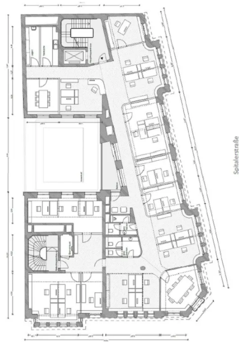
Beispielgrundriss OG 4 - 468 m 2