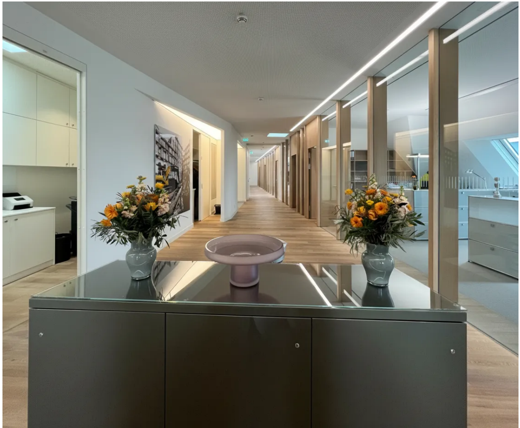
Bispiel | Innenansicht