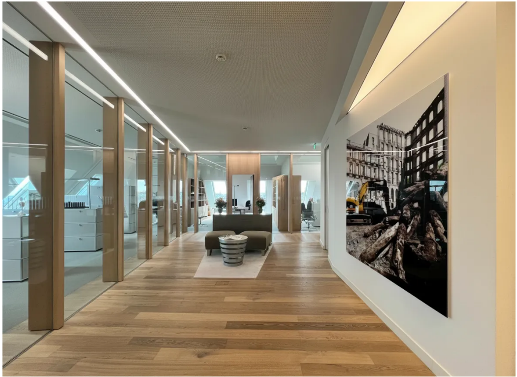
Beispiel | Innenansicht