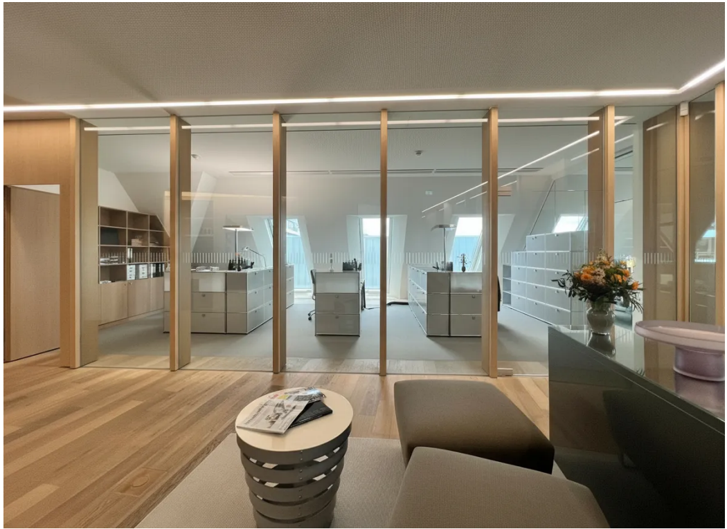
Bispiel | Innenansicht