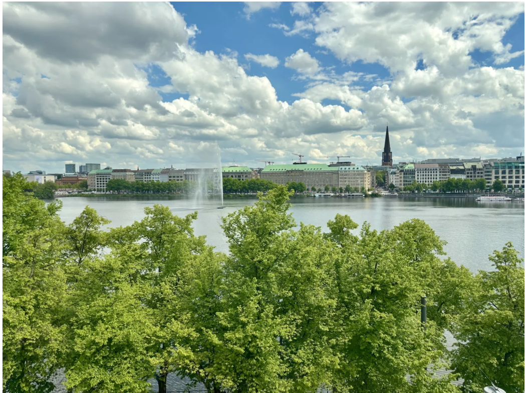
3. OG | Ausblick