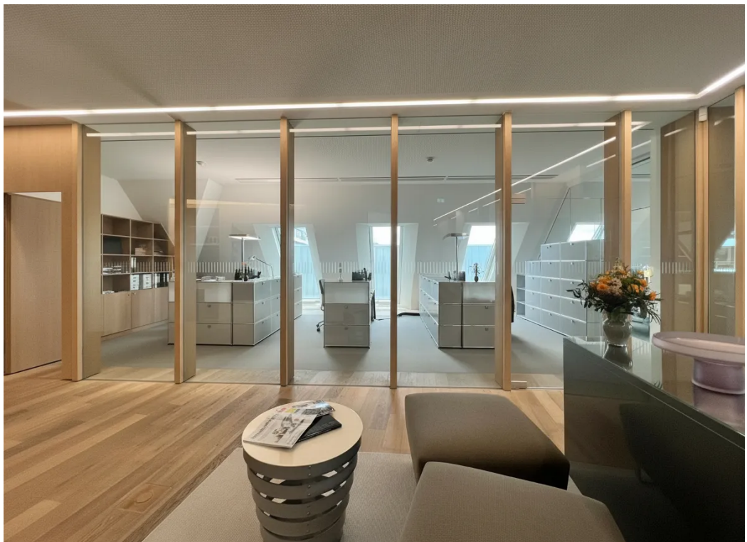
Bispiel | Innenansicht