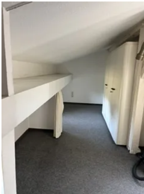
DG links Abseite Bild 1