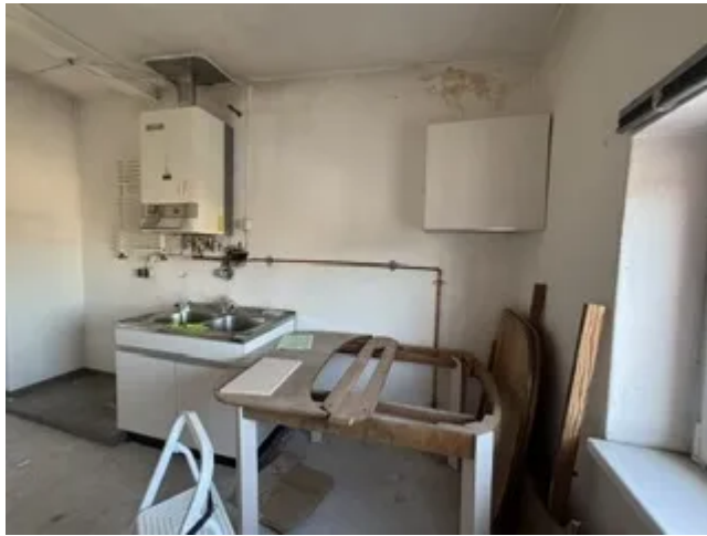
DG links Küche Bild 2