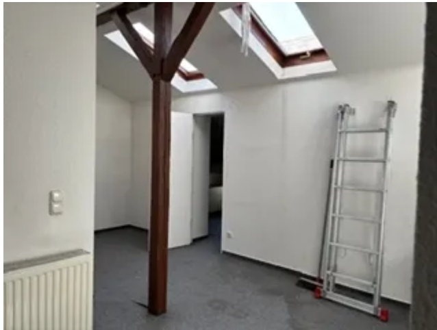
DG links Flur Bild 1