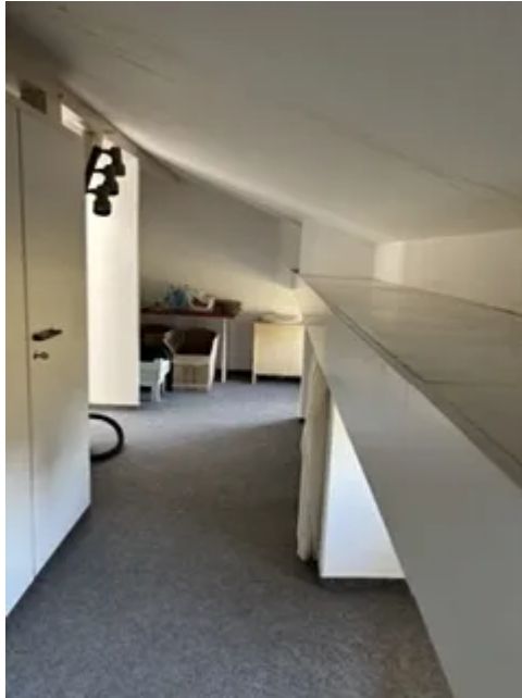
DG links Abseite Bild 2