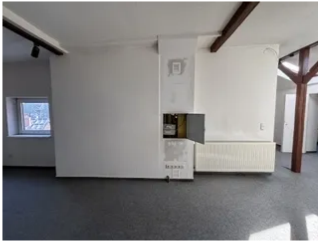
DG links Raum Bild 3