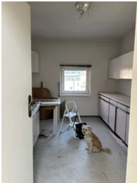
DG links Küche Bild 1