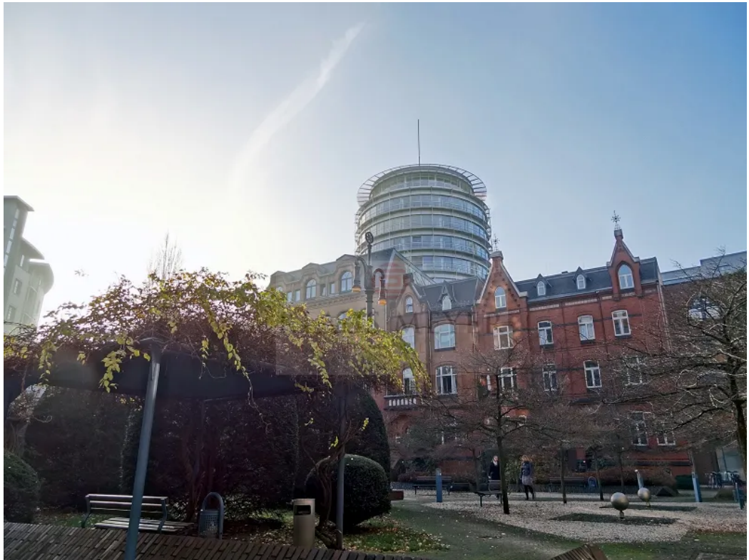
Ansehen kostet nichts