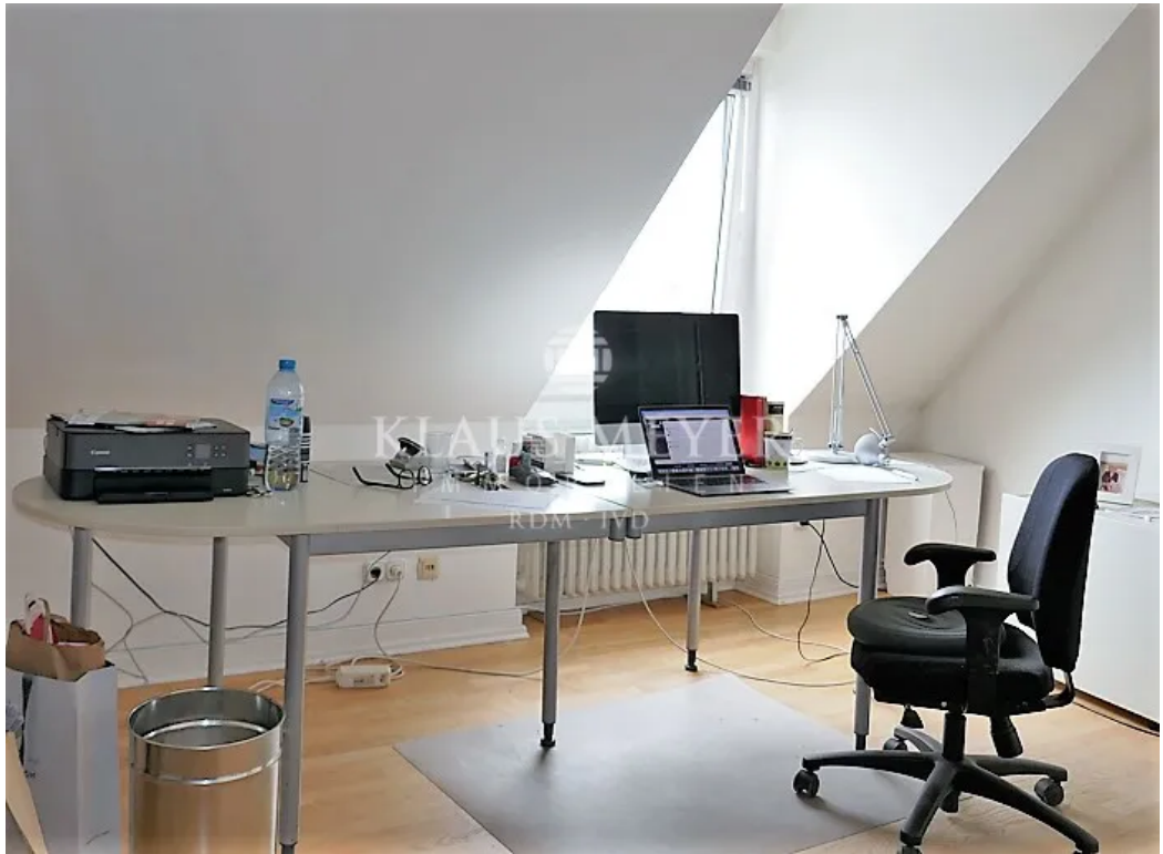
im 6. OG