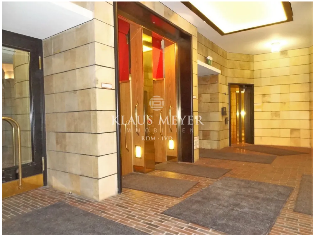
Paternoster u. Aufzug