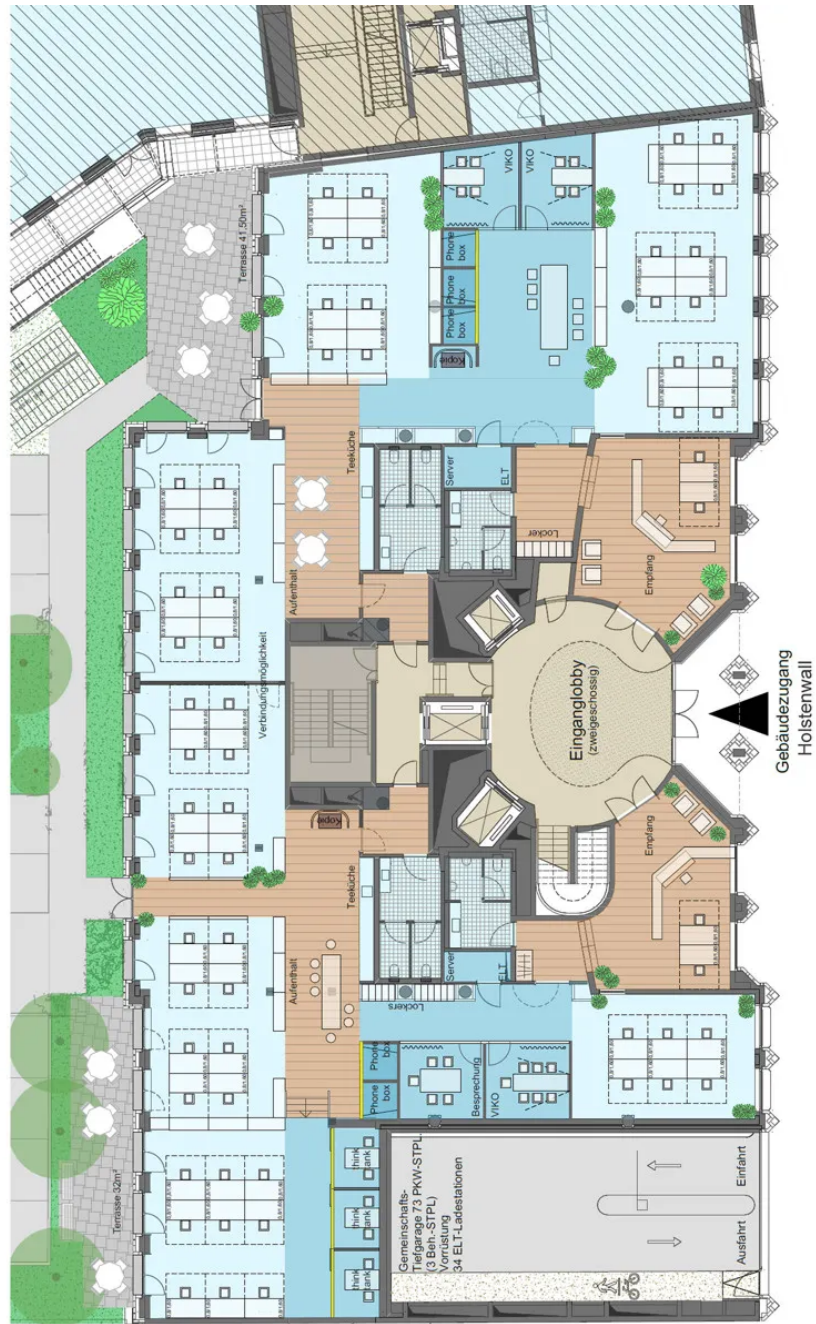
Grundriss EG ca. 922 m 2