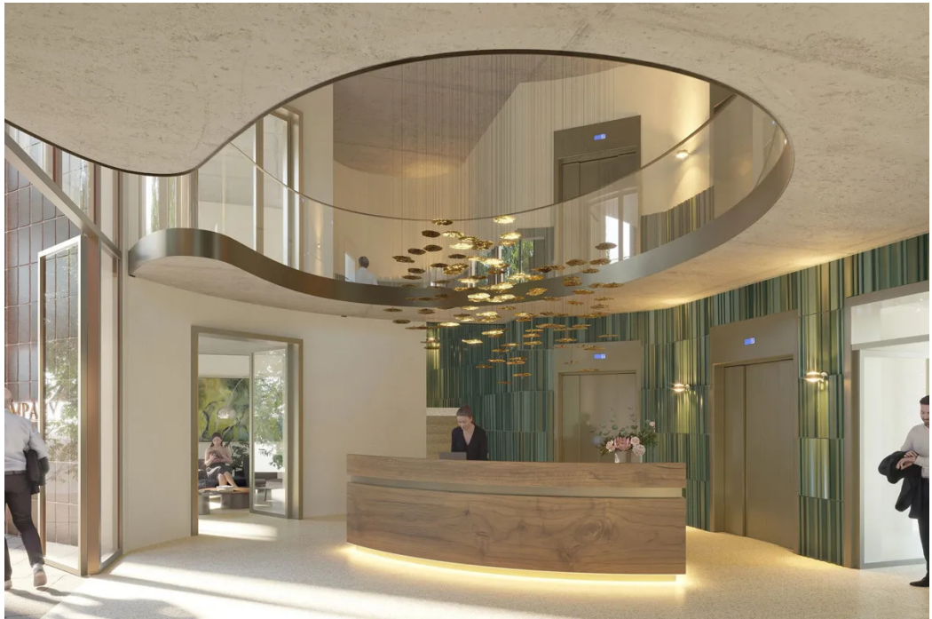
Visualisierung - Lobby / Eingangssituation