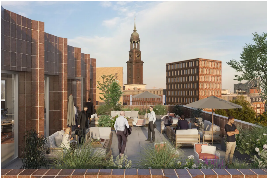
Visualisierung - Dachterrasse