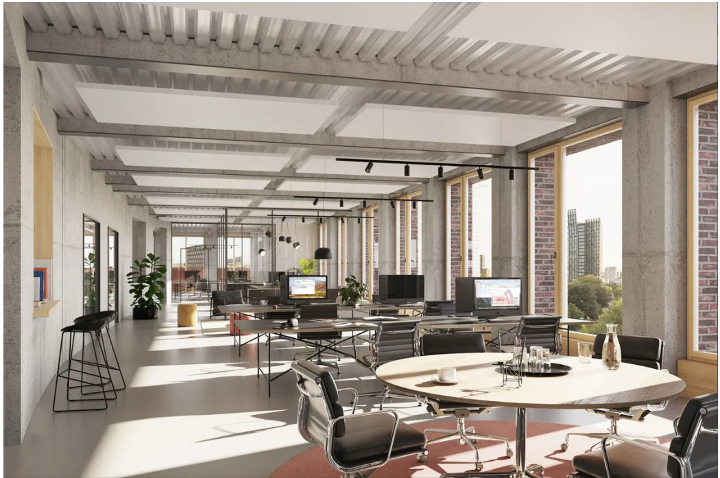
Visualisierung - Ausblick 3. OG