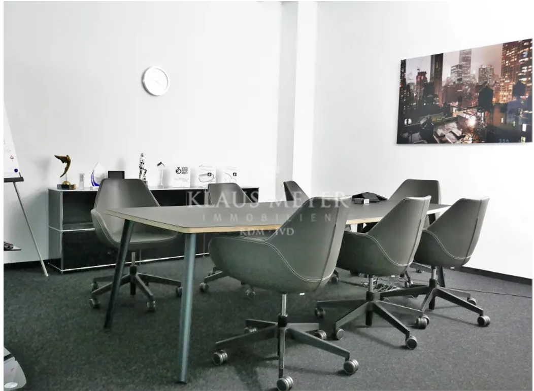
Beispiel im Büro