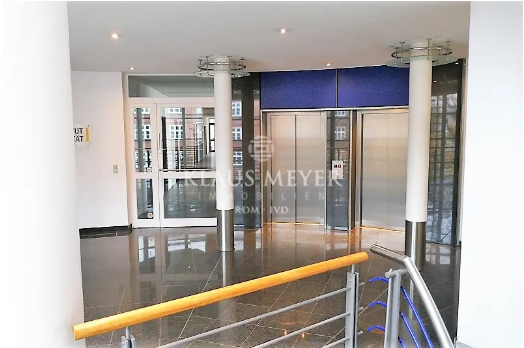
Fahrstuhl direkt TG