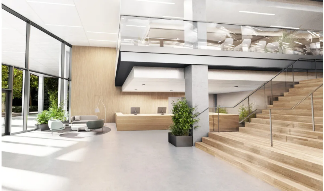
Visualisierung - Lobby