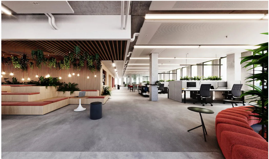
Visualisierung - Turmetage