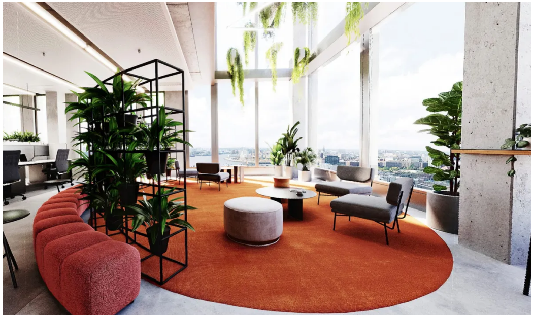
Visualisierung - Turmetage