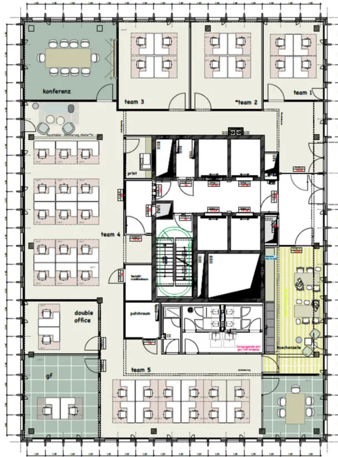
Grundriss 11. OG