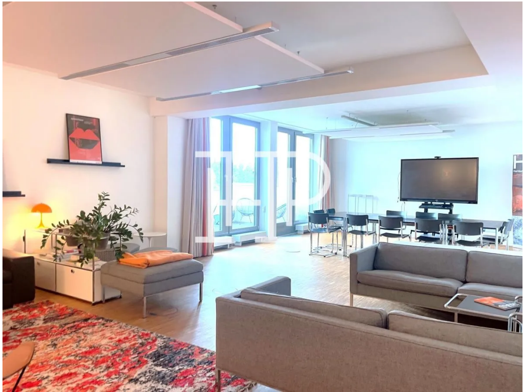
Großzügig und einladend