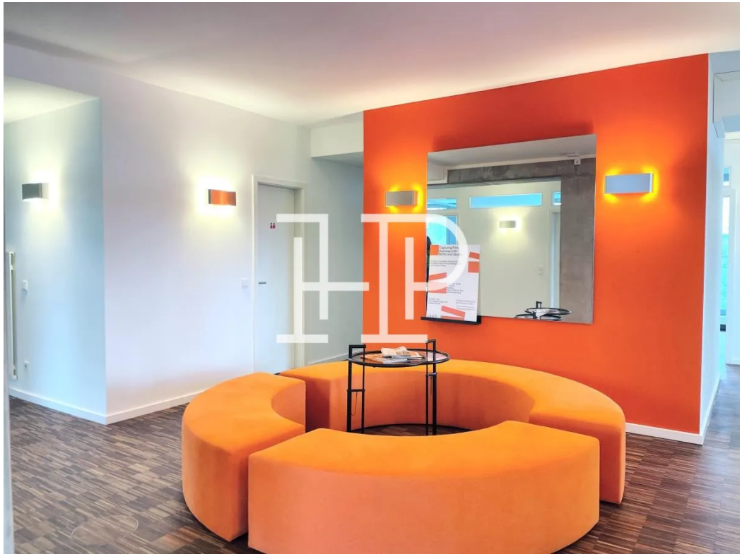
Empfangs- oder Wartebereich