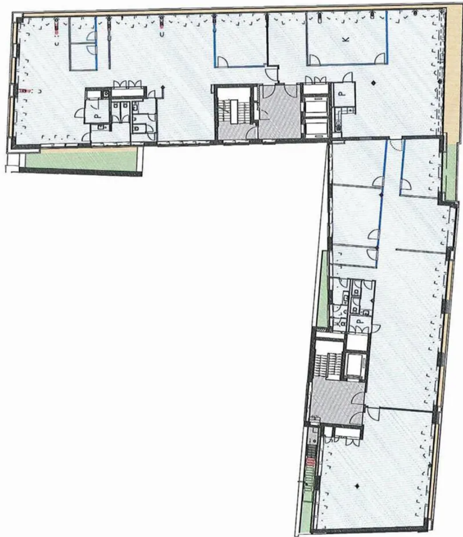
Grundriss 6. OG