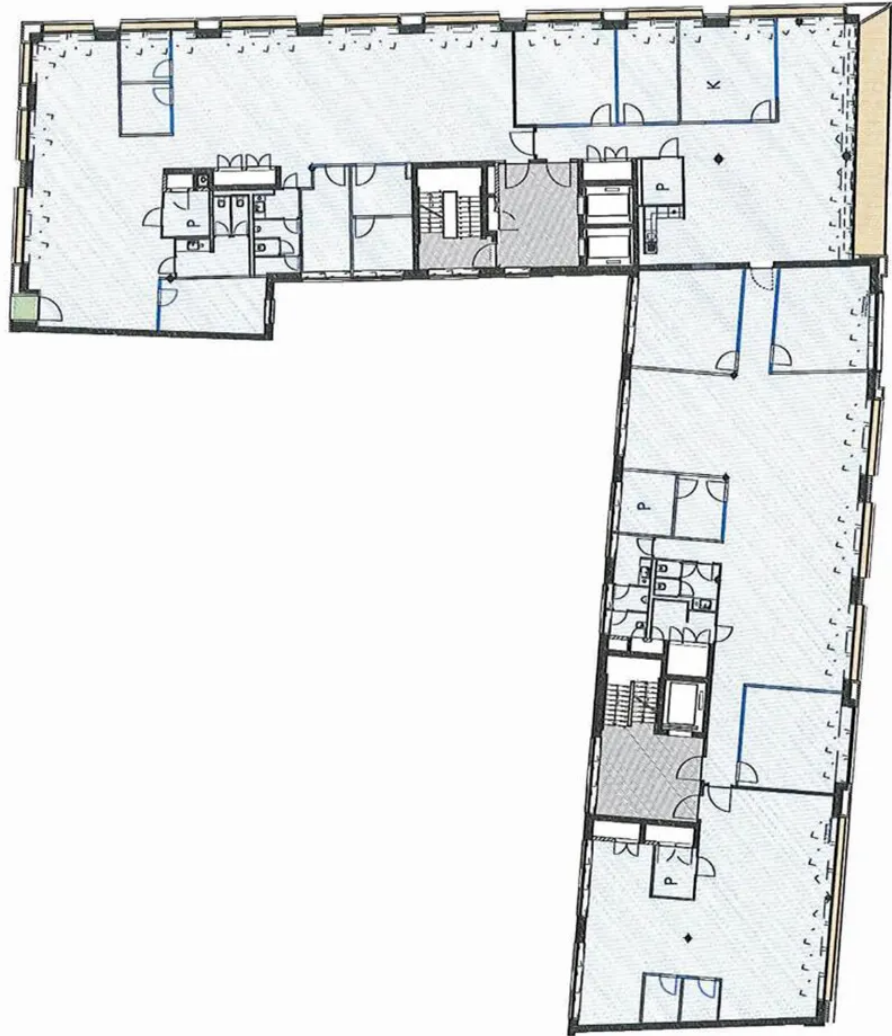
Grundriss 5. OG