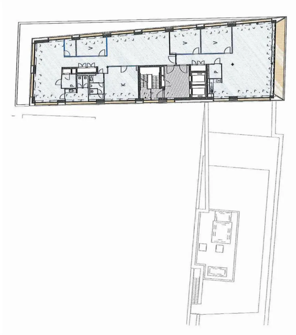
Grundriss 8. OG