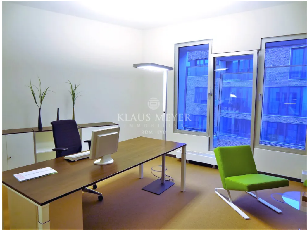
Beispiel Ausstattung Musterbüro (6)