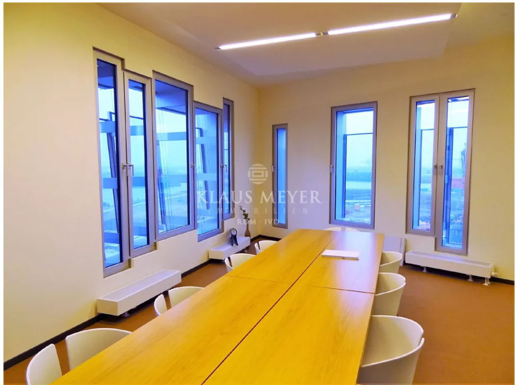
Beispiel Ausstattung Musterbüro (7)