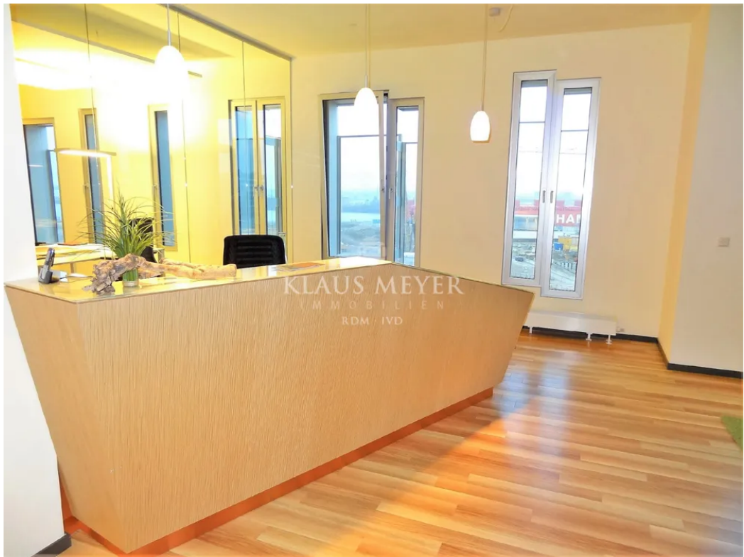
Beispiel Ausstattung Musterbüro