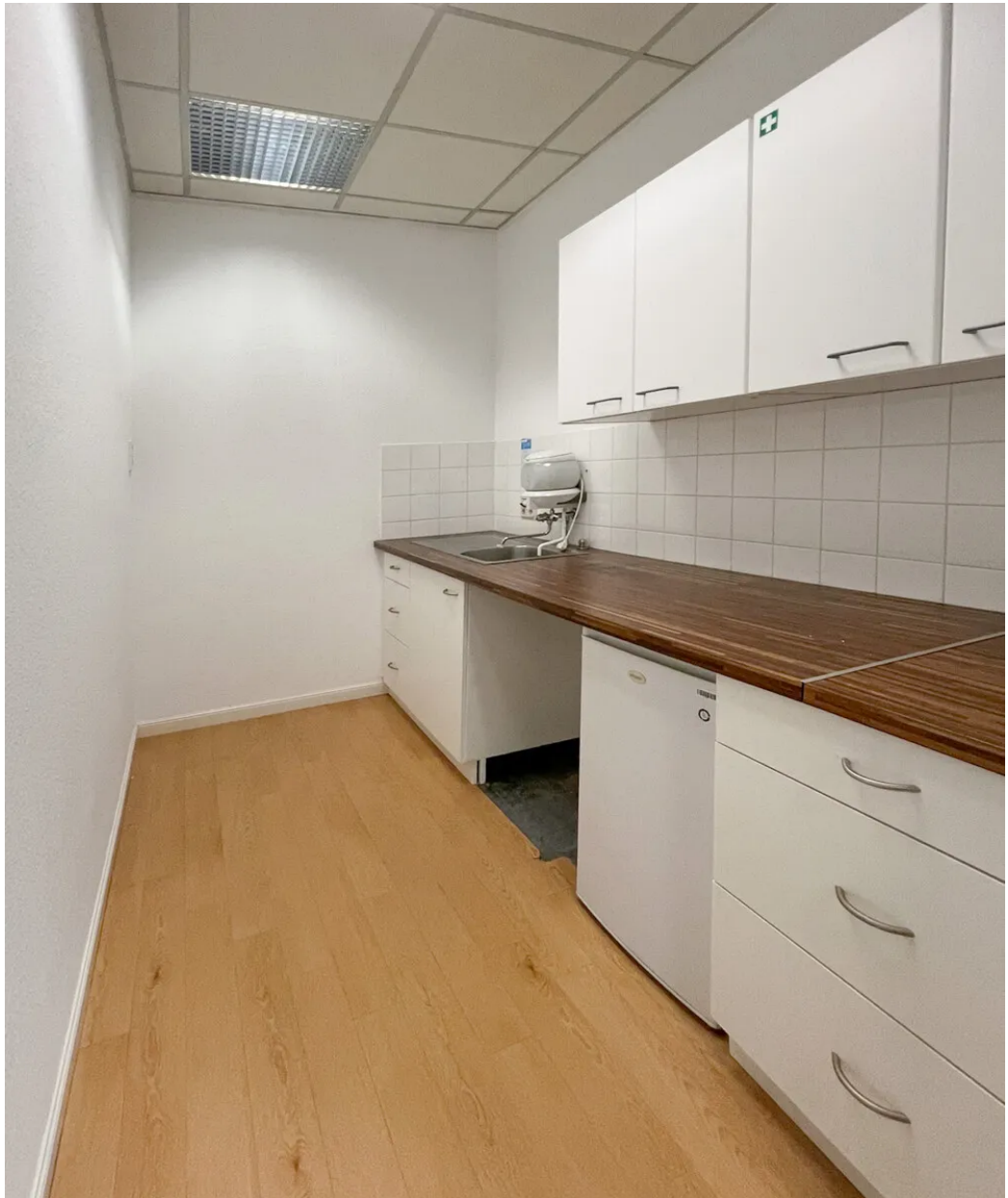
Weitere Ansichten 1. OG (ca. 170m 2 )