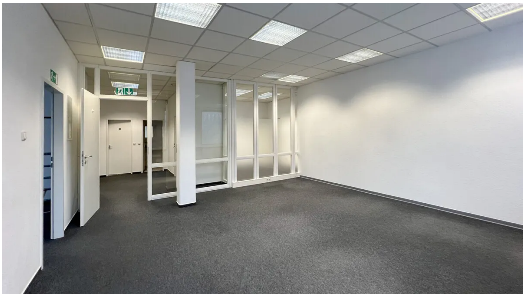
Weitere Ansichten 1. OG (ca. 170m 2 )