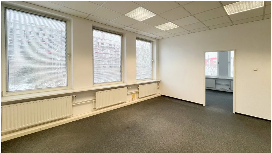
Weitere Ansichten 1. OG (ca. 170m 2 )