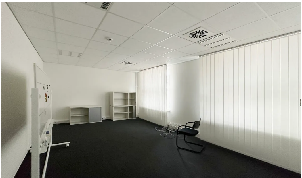
Weitere Ansichten - 1. OG (ca. 276m 2 )