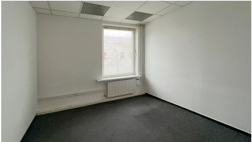
Weitere Ansichten 1. OG (ca. 170m 2 )