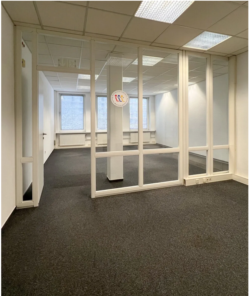
Weitere Ansichten 1. OG (ca. 170m 2 )