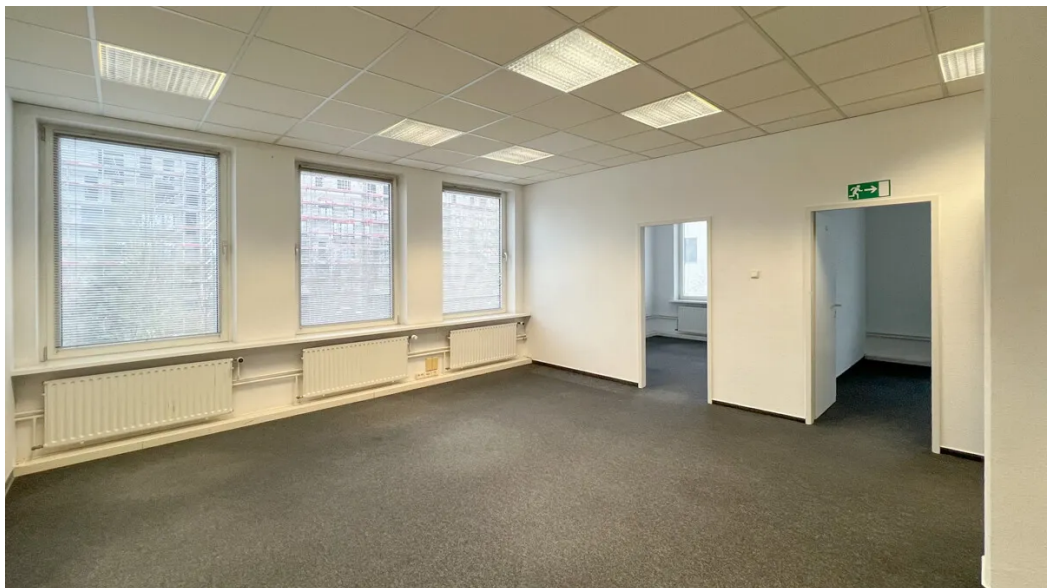
Weitere Ansichten 1. OG (ca. 170m 2 )