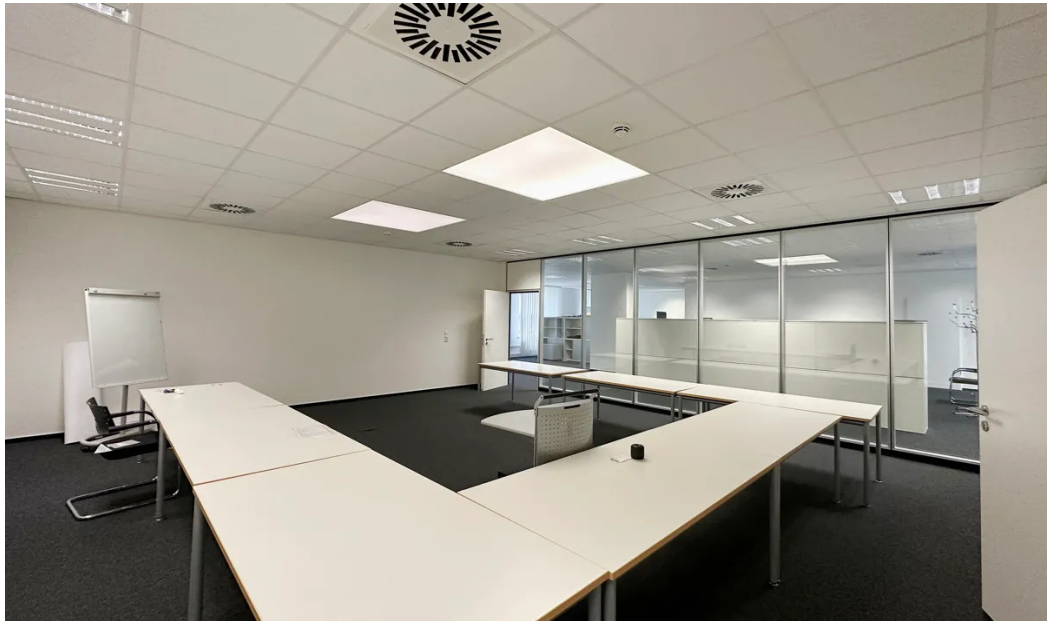
Weitere Ansichten - 1. OG (ca. 276m 2 )