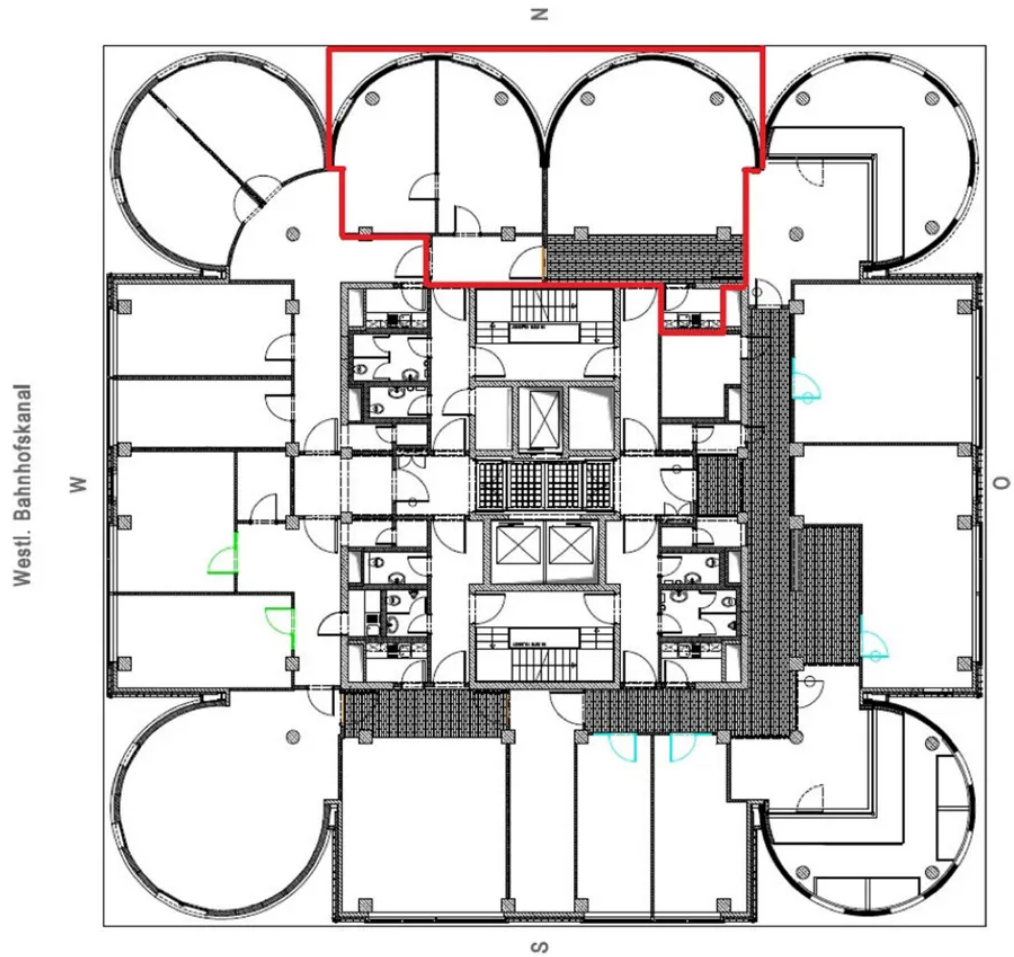
Grundriss 3. OG (ca. 135m 2 )