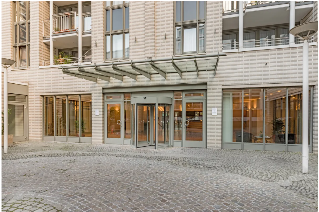
Weitere Ansichten - Eingang