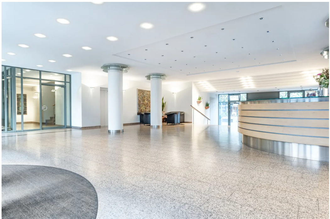
Weitere Ansichten - Foyer