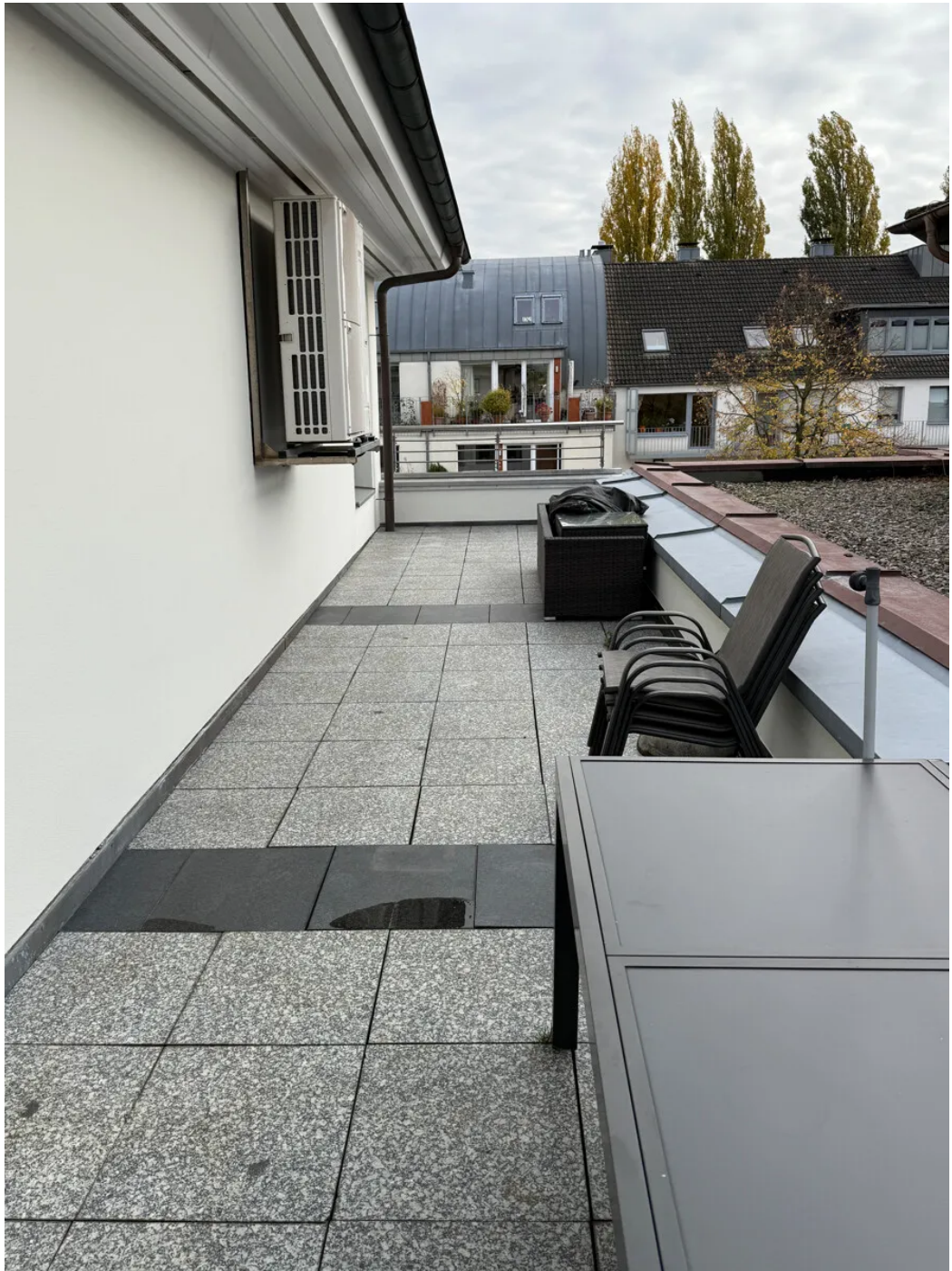
Weitere Ansichten - Staffelgeschoss