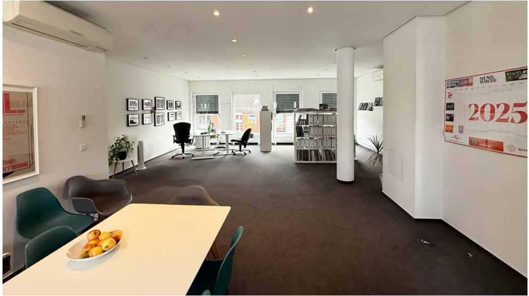
Weitere Ansichten - Staffelgeschoss