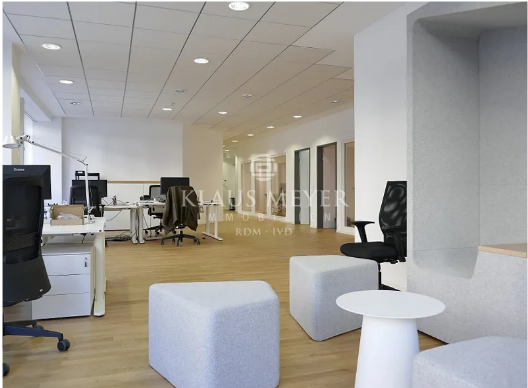
385 m 2 , Echtholzboden