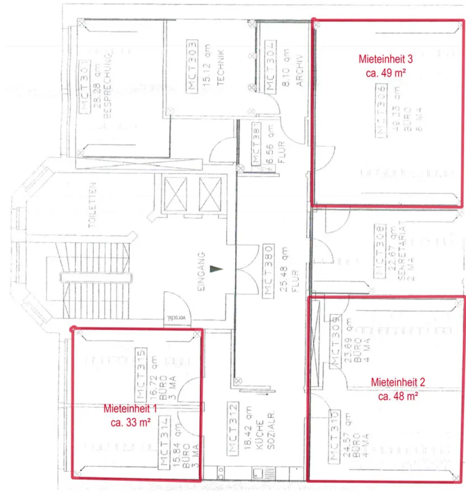
Variante Anmietung Teilflächen (2. OG)