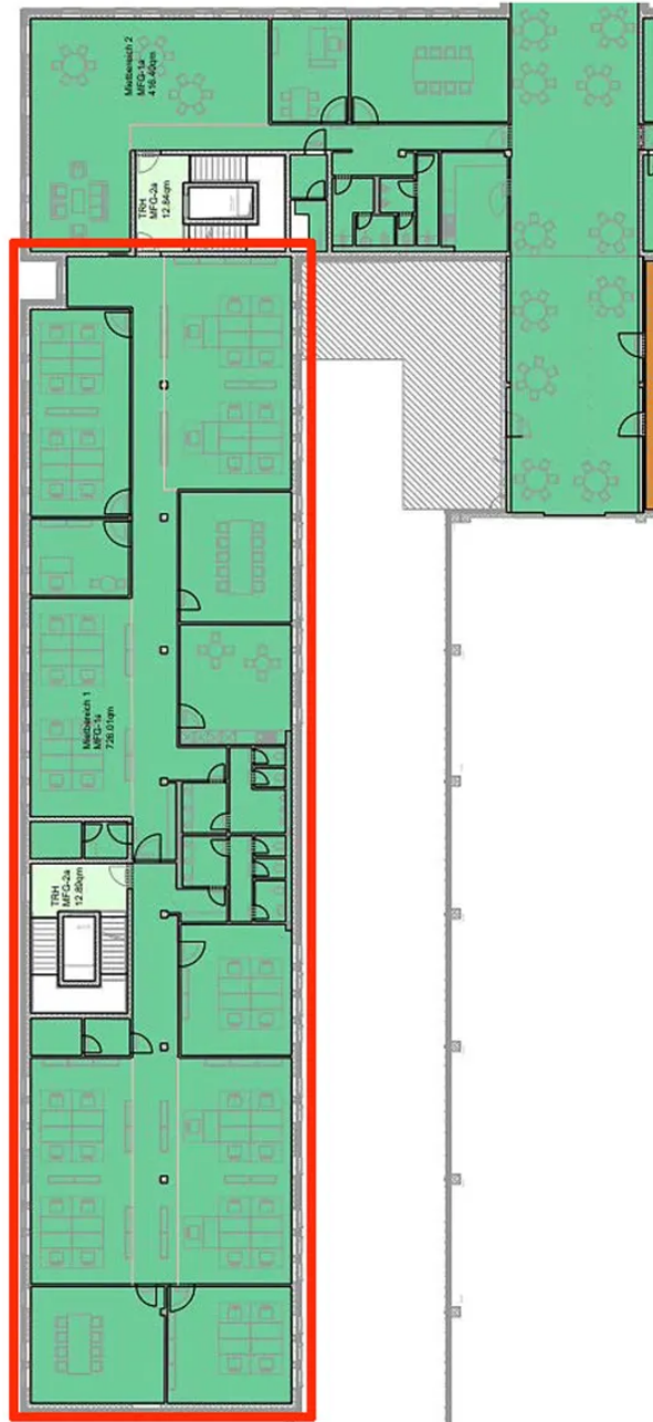
Grundriss 2. OG