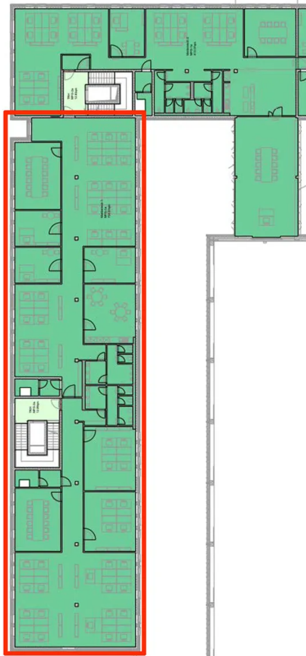
Grundriss 3. OG